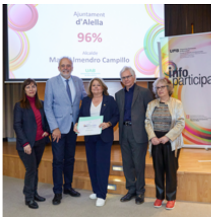
L'acte de lliurament es va fer el 9 d'abril.

Els 52 indicadors en què es basa l'avaluació dels webs han estat actualitzats en aquesta onzena edició: malgrat el nivell més alt d'exigència, els resultats