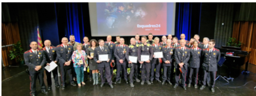
L'acte de celebració del Dia de les Esquadres va reunir més de 160 persones a l'Espai d'Arts Escèniques

Els Mossos d'Esquadra van fer un reconeixement a la Unitat Dron de la Policia Local.