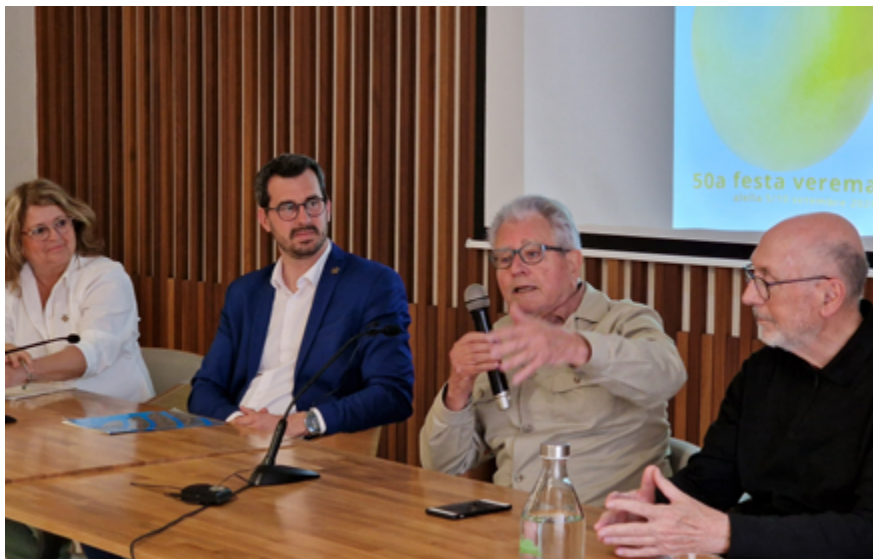
El 18 d'abril es va fer la presentació de la imatge de la 50a Festa de la Verema.

Ja fa molts mesos que l'Ajuntament treballa en els preparatius d'aquest im-