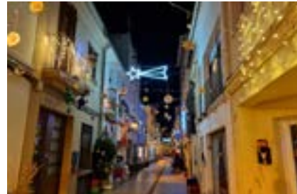
A dalt 2n premi de carrers i a baix 2n premi de façanes.