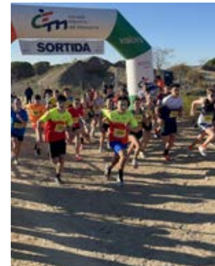
El 15è Cros d'Allella és puntuable al circuit maresmenc.

Més de 300 atletes, de diferents categories, van participar en el 15è Cros d'Allella que es va celebrar el 17 de desembre, coincidint amb la Fira de Nadal i els actes de La Marató. El Bosquet es va tornar a convertir per unes hores en una pista d'atletisme en una prova puntuable per al circuit maresmenc de cros. A les proves generals, es va afegir un any més la cursa