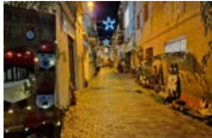
A dalt 1r premi de carrers i a baix 1r premi de façanes.

Anselm Clavé i el 3r per al carrer Univers, que rebran un premi de 300, 200 i 100 euros, respectivament. Els premis del concurs de façanes van ser Anselm Clavé 13, la plaça de l'Art i Anselm Clavé 22. Aquests premis estan dotats amb 200, 100 i 50 euros.