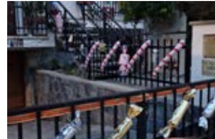
A dalt 3r premi de carrers i a baix 3r premi de façanes.