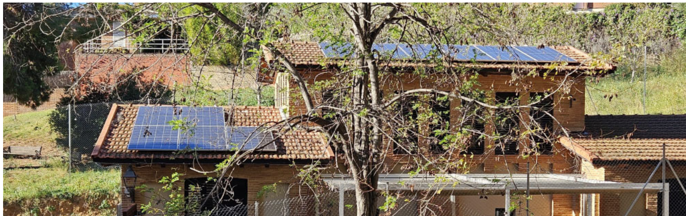
A la teulada de la comissaria de la Policia Local s'han instal·lat 27 mòduls de plaques solars.

S'han instal·lat més de 220 panells fotovoltaics a les teulades de diferents edificis públics.