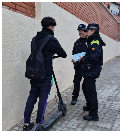
Agents de proximitat fan campanya a l'Institut.

La Regidoria de Seguretat Ciutadana ha iniciat una campanya informativa i de control sobre la normativa que regula la circulació amb patinets elèctrics, en vigor des de gener de 2021, que equipara aquest mitjà a la resta de vehicles i estableix que han de complir les normes del Codi de Circulació. La regulació estableix mesures de seguretat adequades a aquests vehicles, cada cop més presents a la via pública, per tal de fer compatible l'ús d'aquest mitjà de transport personal, pràctic i sostenible, amb la seguretat dels vianants i la resta de vehicles.