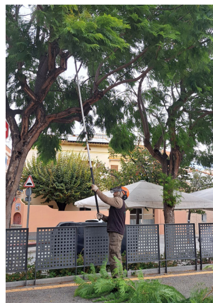
Els treballs es van iniciar el 22 de novembre.

L'Ajuntament va adjudicar a l'empresa Paisatgisme Melsió S.L.U el servei de poda i manteniment de l'arbrat municipal per un import de 28.044 (IVA inclòs) a l'any, prorrogables en terminis d'any en any durant un màxim de dos exercicis més.