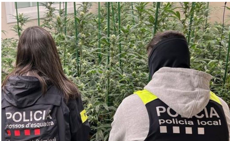
L'actuació conjunta de la Policia Local i Mossos va permetre desarticular un grup dedicat al tràfic de drogues.

En l'entrada al domicili, realitzada el passat 9 de novembre, s'han detingut dues persones que actuarien com a jardineros de la plantació. També s'ha comprovat que aquesta plantació s'estenia a 6 estances de la casa, a ple rendiment. Més de 250 plantes tenien una mida de més de 1,20m. Així mateix, s'han comissat 426 grams de marihuana en una bossa, 47 mòduls de led, 9