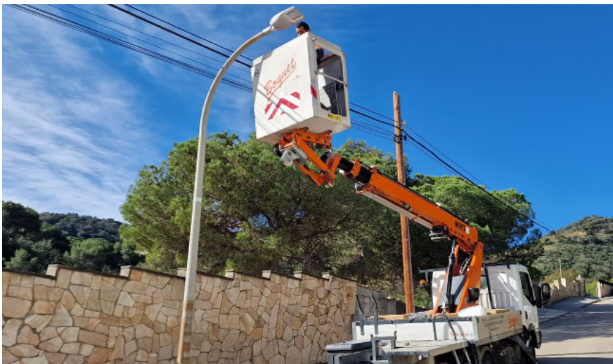
Els punts de llums dels barris de Can Comulada i Mas Coll s'han substituït per llumeneres Led.

L'any 2022 es van substituir una seixantena de projectors i llumeneres de