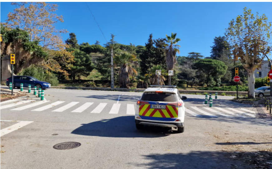
L'encreuament semafòric facilita l'accés a la carretera als vehicles d'emergències i de serveis.

Des del mes de novembre està en funcionament el sistema semafòric que permet accedir als vehicles d'emergència (Policia Local i l'ambulància del SEM d'Alella i els vehicles de l'ADF) a la carretera BP-5002 des del passeig de Marià Estrada. L'encreuament semafòric es regula mitjançant un comandament a distància i permet resoldre la problemàtica d'aquesta intersecció per accedir amb rapidesa a la carretera, una via molt utilitzada pels vehicles policials i sanitaris, que tenen les seves centrals al barri de Vallbona i han d'utilitzar aquesta via per sortir a la carretera. A més dels semàfors de la intersecció, s'ha millorat la senyalització de la zona, amb una inversió de 48.000 euros.