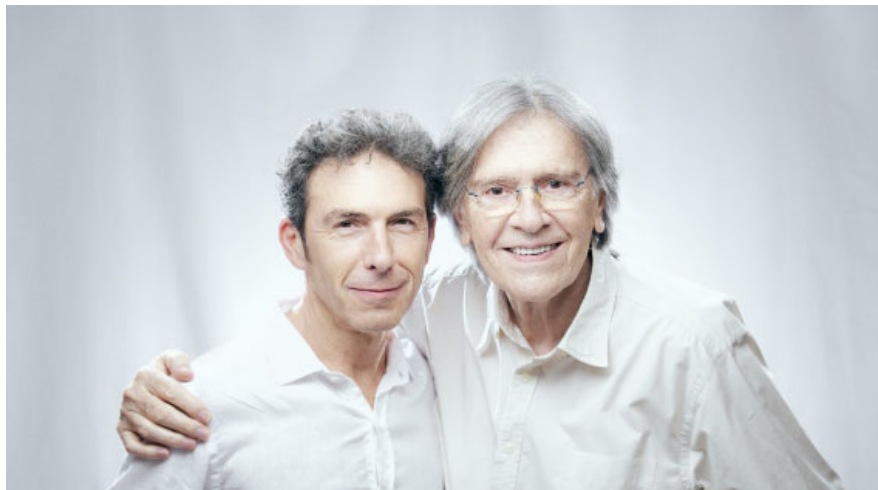
Josep Maria Flotats farà residència a Alella amb la nova adaptació de La Disputa que es podrà veure el 12 de gener.