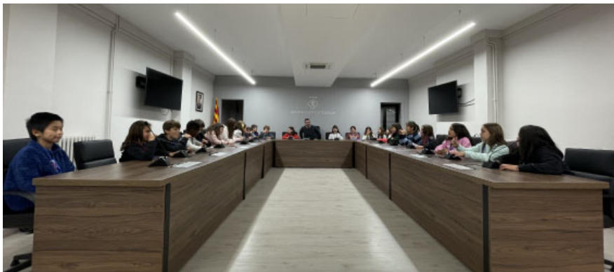
El 21 de novembre es va fer l'acte de presa de possessió dels nous consellers i conselleres del Consell d'Infància

El Consell d'Infància Municipal del curs 2023-2024 es va constituir formalment el 21 de novembre amb la presa de possessió dels nous consellers i conselleres i dels assessors i assessores. Amb l'acte de constitució culmina el nou procés d'elecció en el qual s'ha renovat la meitat de la representació amb la incorporació de l'alumnat que cursa cinquè de primària a les escoles d'Alella o que està empadronat al poble i estudia fora del municipi.