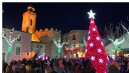
L'encesa de llums es farà el 2 de desembre.

Després de dos anys amb una celebració adaptada a la pandèmia, enguany es recupera la normalitat de les festes nadalencs. L'Ajuntament ja ha posat en marxa la maquinària per a les diferents propostes que s'organitzen per promocionar el comerç i l'ambient nadalenc i festiu. Des del Consistori s'anima els comerços a participar en el concurs d'aparadors nadalencs, amb