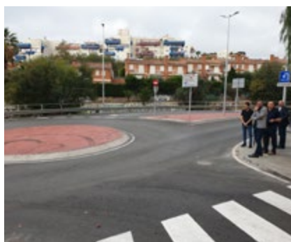
Les obres han superat els 427.000 euros d'inversió.

Amb una inversió de 427.356 euros, les obres han consistit a millorar el pas de vianants situat a l'inici de la via, així com en els girs a l'esquerra i les incorporacions a la carretera, amb reducció de la velocitat de circulació. En