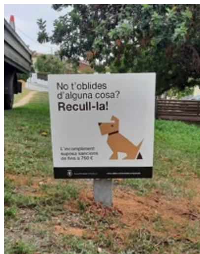
Les plaques s'han instal·lat a una vintena d'espais.

L'Ajuntament instal·la plaques informatives a una vintena d'espais públics per conscienciar la ciutadania de l'obligació de recollir els excrements dels gossos.