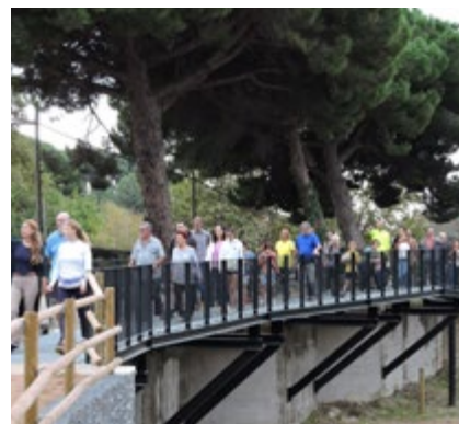
Una seixantena de persones van assistir a l'acte.

naran continuïtat. La primera és el projecte d'arranjament i pavimentació de Guifré el Pilós, des del barri de Vallbona fins al Camp d'Esports. L'actuació contempla l'adequació de la via pública exterior de les instal·lacions per millorar la seguretat i facilitar l'accés a vehicles i vianants. El projecte s'ha licitat per 287.293 euros i un termini d'execució d'un mes i mig d'obres.