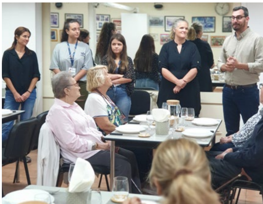
El servei d'Àpats en companyia es va posar en marxa el 2 de novembre.

Els àpats es fan a Can Gaza, de dilluns a divendres, en un espai dinamitzat per integradores socials.