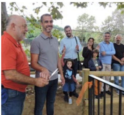
Dos representants dels clubs esportiu van tallar la cinta.