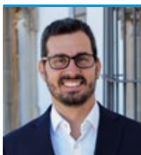
L'alcalde, Marc Almendro Campillo

Ho hem dit i ho diem, perquè és el que fem al dia a dia: la nostra màxima és servir sempre a les persones. Perquè les persones són el centre de totes les decisions que prenem al capdavant de l'Ajuntament. Des de les polítiques socials, educatives o culturals, fins a les de manteniment i millora de la via pública o la seguretat ciutadana. Perquè som servidors i servidores públiques i estem al servei de la ciutadania del nostre poble.