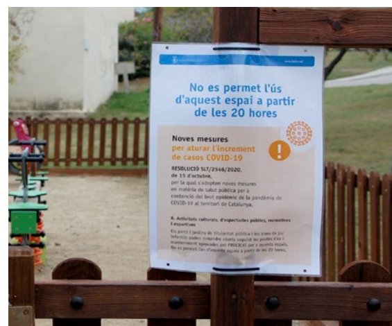
L'ús dels espais públics va estar limitat durant mesos.

Al marge del personal sanitari i assistencial, la pandèmia ha afegit més càrrega a altres serveis com ara la Policia Local o els serveis de neteja viària. Durant l'estat d'alarma, la policia al·lenca va tramitar un total de 751 denúncies per incompliments de les restriccions per la COVID, la majoria per no respectar les prohibicions de mobilitat, per