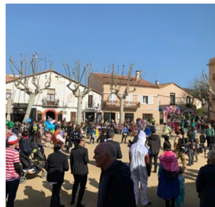
L'Ajuntament va recuperar la rua de Carnestoltes.

cartells de Festa Major. El concurs és obert a professionals i novells i les obres s'han de presentar abans del 19 de maig. La votació popular es farà del 23 de maig a l'1 de juny. www.alella.cat/festamajor .