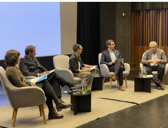
La presentació es pot veure al canal de Youtube.

Les sessions es faran el 20 d'abril i el 4 i 17 de maig.