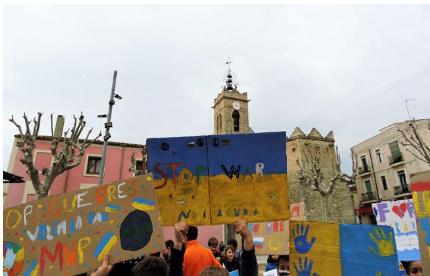
Alumnes de l'Escola La Serreta es van manifestar en contra de les guerres i a favor de la Pau el 18 de març.

Des de l'inici del conflicte bèl·lic a Ucraïna, l'Ajuntament s'ha sumat a la crida de suport per atendre a la població afectada i es manté amatent a les necessitats que puguin sorgir dins de la campanya d'emergència per donar suport a la població ucraïnesa. Les accions humanitàries estan coordinades a través del Consell Assessor Territorial de Barcelona, en què estan representants tots els municipis de la demarcació, per donar una resposta coordinada i organitzada d'atenció a les persones refugiades que arriben a Catalunya i donar suport a la població afectada per la guerra. Per aquest motiu s'han creat unes Taules Territorials de Contingència per organitzar tècnicament les necessitats de cada municipi.