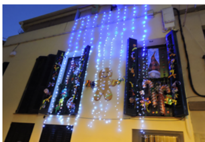
A dalt, 2n premi de façanes i a baix 3r premi de façanes.