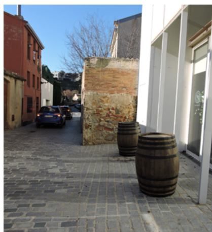
Reordenació del carrer de Santa Madrona.