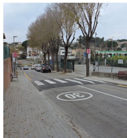
Millora de l'accessibilitat a Guilleries.