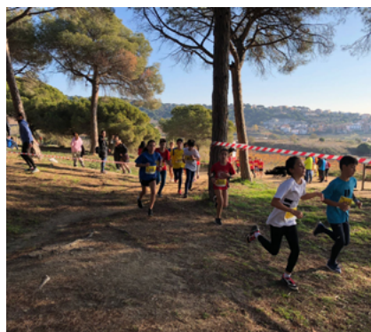
El bon temps va acompanyar el Cros d'Alella.

Després d'un any sense competició per la pandèmia, la zona del Bosquet va tornar a convertir-se el 19 de desembre en un circuit d'atletisme per acollir la 13a edició del Cros d'Alella, puntuable per al circuit maresmenc. La prova va batre rècords de participació amb un total de 353 atletes, a les diferents categories de la competició. A aquesta xifra, cal afegir una cinquantena més d'aficionats que van voler sumar-se a