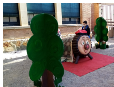
Moments de la Fira de Nadal i de l'encesa de llums.