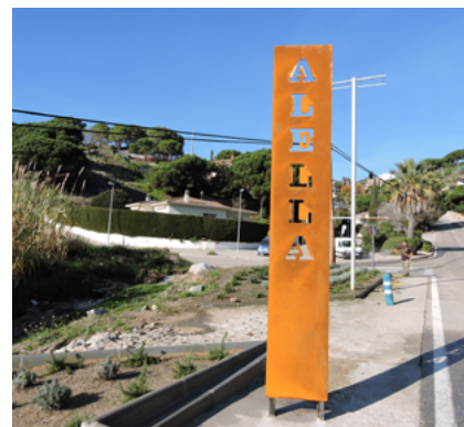
Arranjament de l'entrada a Alella Parc.

També s'iniciarà la reforma de les "Cases dels Mestres" per reconvertir-les en tres habitatges socials. L'obra ha estat adjudicada a Construccions Deumal per un import de 358.039 euros.