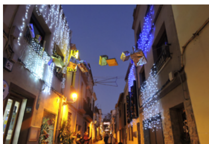
A dalt, premi de carrers, i a baix 1r premi de façanes.

Alella va recaptar un total de 4.906 euros a les diferents activitats organitzades per l'Ajuntament i per les entitats per a La Marató de TV3. La major part dels actes es van celebrar el cap de setmana 18 i 19 de desembre juntament amb les activitats nadalenes.