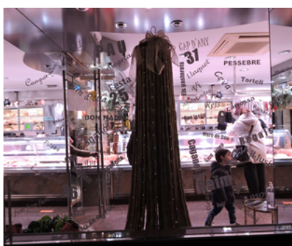
Casa Librada: premi a l'aparadors sostenible.