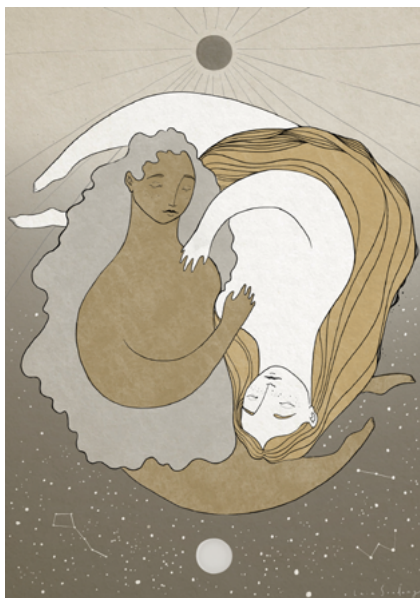
Il·lustració de Laia Sondang.

En l'apartat musical, Ensemble Exclamatio ofereix el concert Muovere l'affetto dell'animo , emmarcat dins de