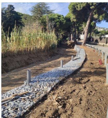
Tot a punt per reprendre els treballs del Tram A.