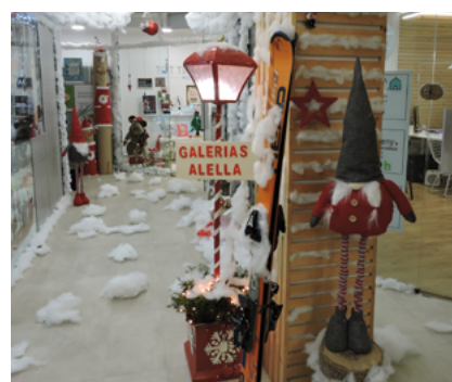
Galeries: premi a l'aparador festiu.