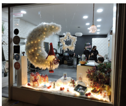
Cut me perruquers: premi a l'aparador original.