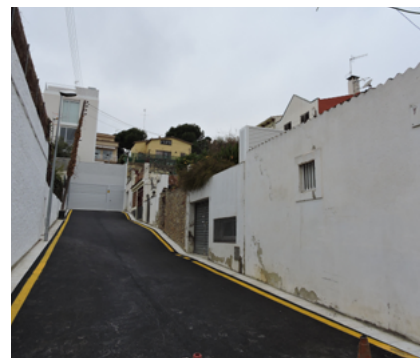
Pavimentació asfàltica del carrer del Nord.