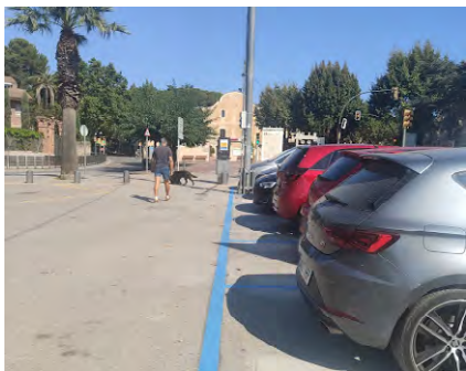
Les zones blaves entren en funcionament el 9 de setembre.

L'Hort de la Rectoria passa a ser considerat estacionament d'alta rotació per facilitar l'accés a la zona comercial.