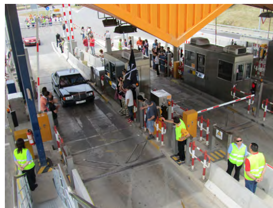
Imatge d'un dels darrers actes reivindicatius.