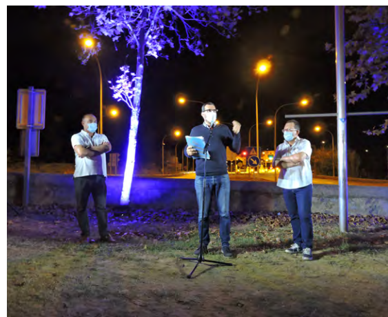
Els alcaldes d'Alella, el Masnou i Teià, van fer pinya a l'acte.

Des de l'Ajuntament s'han mantingut reunions amb la Generalitat per demanar la realització de millores viàries als accessos i el manteniment de la via un cop finalitzada la concessió. Entre altres actuacions es treballa en la futura construcció d'una rotonda que millori l'encaix d'aquesta via amb la carretera BP-5002 i també en la implementació d'accessos directes a Teià i el Masnou, per evitar la concentració del trànsit en aquest punt.