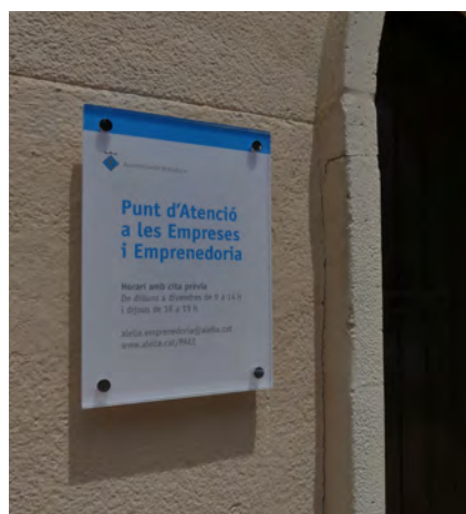
El PAEE està ubicat a les oficines situades al costat del moll de càrrega del Mercat, a l'antic jutjat de pau.

Entre d'altres serveis, el Punt d'Atenció a l'Empresa i a l'Emprenedoria ofereix informació per promocionar i dinamitzar el comerç i la restauració, fent acompanyament i assessorament per formar part del market place jo-comproaalella.cat . A més, des d'aquest espai també es donarà suport a les gestions del Mercat Municipal.