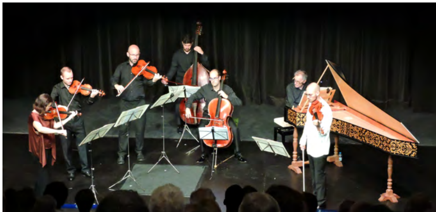
Les entrades per al concert de Músics en Residència es posaran a la venda a partir del 15 de juny a l'Oficina de Turisme.