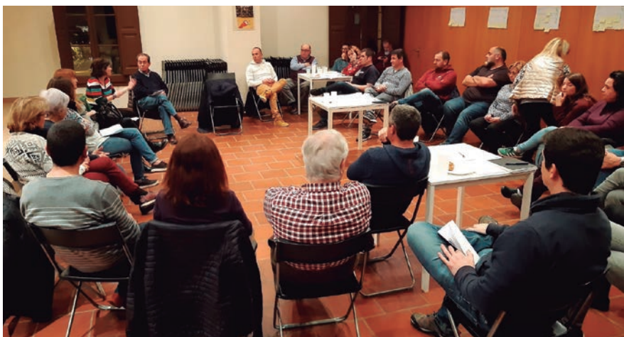
Més d'una trentena de persones, de 19 entitats, van participar a la jornada participativa que es va fer el 18 de gener.

L'Ajuntament encara la recta final per a l'elaboració de les normatives que han de definir les relacions amb les entitats del municipi: el Reglament de Registre Municipal i el Reglament de Suport i Recursos per a les associacions i col·lectius d'Alella. L'objectiu d'aquests dos reglaments és crear una normativa comuna que afavoreixi la igualtat d'oportunitats i d'accés als recursos.