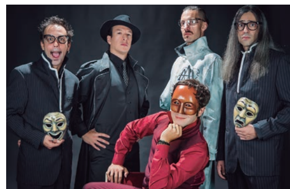
Crimen y telón , de la companyia Ron Lalá.

Fora de la cartellera, l'Espai acollirà el Cicle de cinema social, programat per la Comissió de Cooperació Internacional, la propera edició d'Espais de Poesia i també el primer espectacle conjunt de l'Escola de Dansa i la Coral municipals d'Alella. Consulteu la programació a www.alella.cat