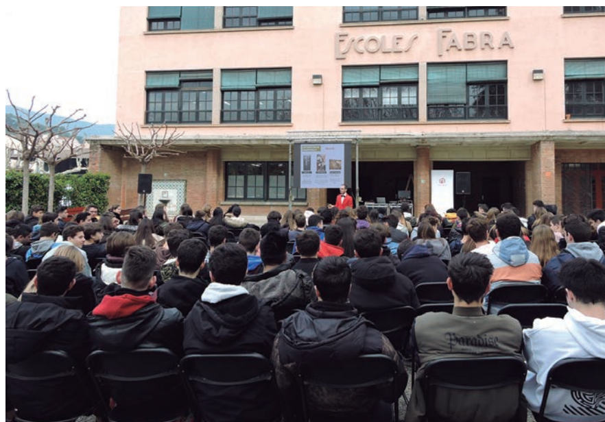
Durant la Setmana de l'Orientació Educativa es faran xerrades, tallers i conferències.

Del 16 al 20 de març s'han programat diferents activitats per ajudar al jovent i les seves famílies a orientar-se pel camí formatiu i professional.