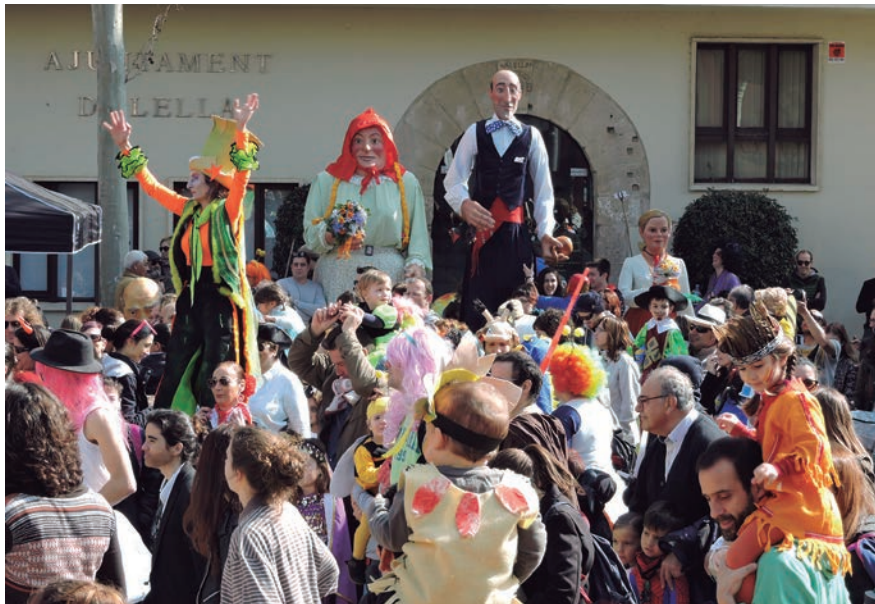
Enguany s'amplia la programació de Carnestoltes i la participació de les entitats en la celebració.

Enguany s'amplien les activitats i la participació de les entitats.