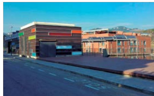
El Complex s'ampliarà amb una nova sala a l'actual terrassa.

Els objectius de la modificació són dos: implantar una edificació destinada a la instal·lació d'una caldera de biomassa que abasteixi d'aigua calenta sanitària i calefacció als dos equipaments esportius i ampliar la sala de fitness i d'activitats polivalents del Complex Esportiu Municipal. La modificació planteja traslladar la superfície d'espais lliures a la zona de Cal Doctor, on actualment hi ha més de 3.000 m 2 d'equipaments que es reduirien a la meitat.