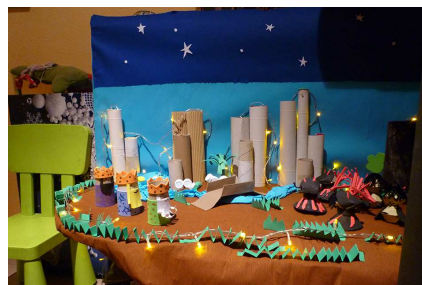
A dalt 1r premi infantil i a baix 1r premi escoles.

que aspiraven als premis d'una de les quatre categories del concurs: infantil (fins a 12 anys); familiar; escoles i entitats, residències i comerços.