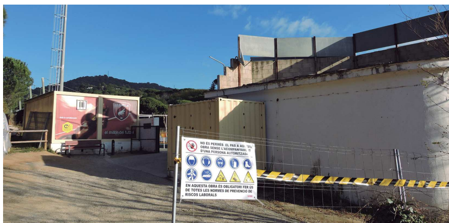
L'edifici actual serà enderrocada i es construirà un de nou de 215 m 2 amb planta baixa i semisoterrani.

La nova seu social es construirà en el lateral del camp, al costat de les grades, on està situada l'actual edificació de planta baixa i pis que acull el bar, els serveis, la bugaderia i el magatzem. És un edifici de 47,88 m 2 per planta en mal estat de conservació i sense valor patrimonial que serà enderrocada perquè no compleix ni amb les dimensions ni amb les prestacions adequades per l'equipament. En el seu lloc es construirà una nova edificació de més de 200 m 2 dividits en planta baixa i semisoterrani que acollirà els serveis