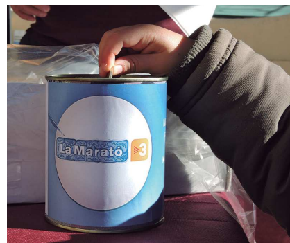
Es van organitzar una dotzena d'activitats.