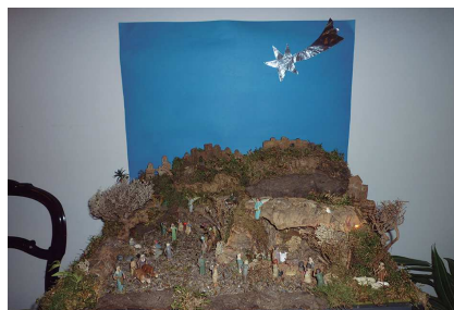
A dalt 1r premi familiar i a baix 1r premi entitats.