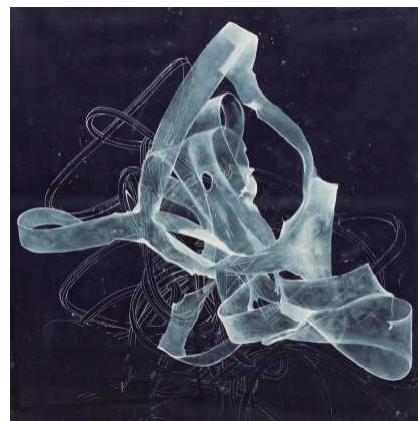
L'exposició es pot visitar del 19 de gener al 18 de febrer.

El treball de Milne planteja, acostant a la quotidianitat, la nostra percepció del món i la pròpia auto-referència. On som? De què es construeix l'univers que habitem? Un univers infinit on la matèria és provocada, segons Lucreci, per la minúscula trajectòria dels primers començaments sense una direcció de lloc i moment determinats. Observem la