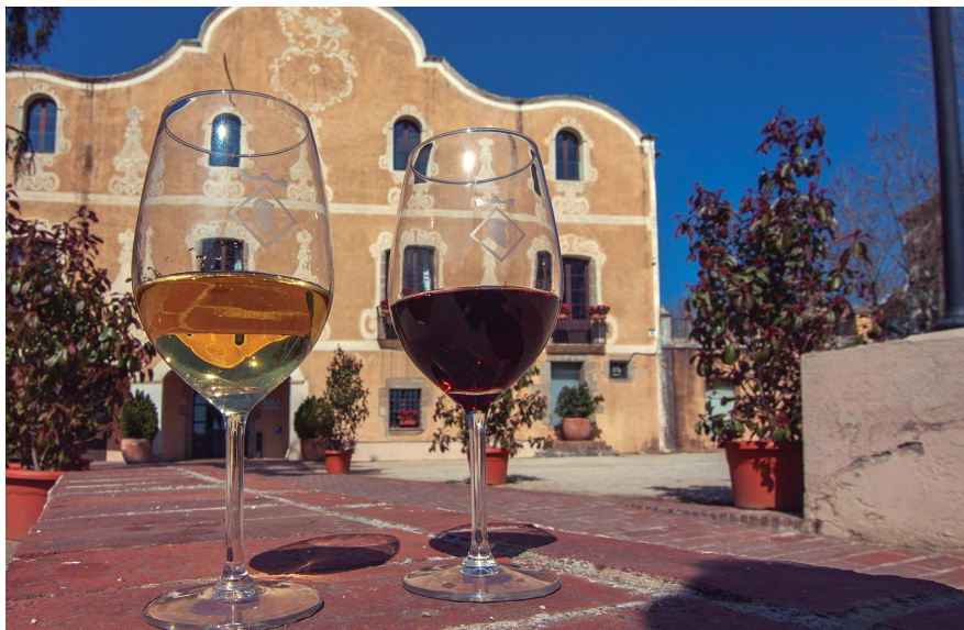
L'Enotast i el Mostast són algunes de les activitats més destacades de la programació enoturística.

Enguany s'amplien les visites guiades i es posen a la venda nous productes de marxandatge.