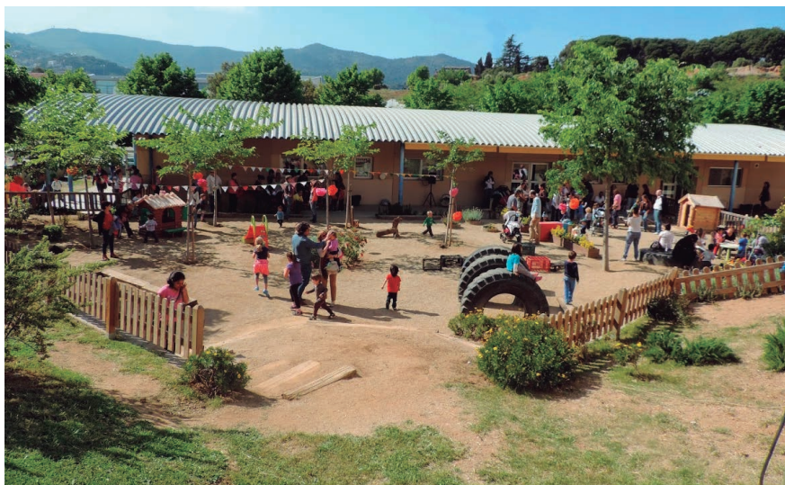
La festa de celebració del desè aniversari està prevista per a la primavera.

Els Pinyons es fan grans. La llar d'infants municipal celebra aquest curs els deu anys de funcionament i de servei al poble. Una comissió formada per educadores i famílies ha començat a treballar en el contingut de la festa del desè aniversari. Serà a la primavera, coincidint amb la plantada de flors prevista per al 23 de març. Entre d'altres activitats, es preveu fer un recull de fotografies, una plantada de flors i un espectacle musical i d'altres propostes pendents de concretar. Des del centre s'anima a totes les famílies que han compartit aquests primers anys de recorregut a participar en la celebració, posant-se en contacte amb la llar.