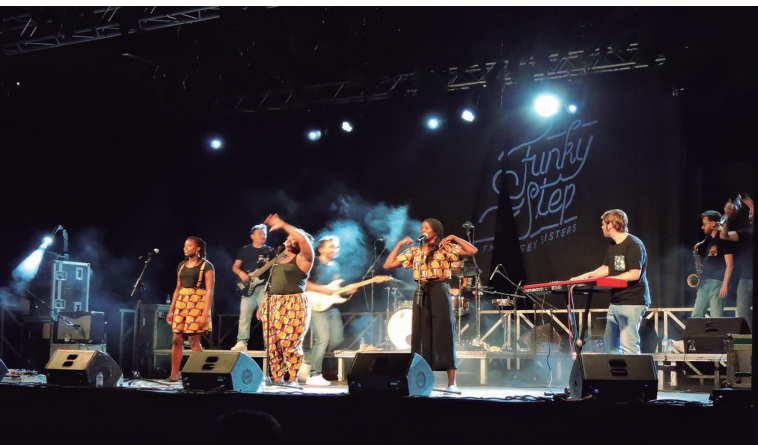
Funkystep and The Sey Sisters al Parc de Can Sors.