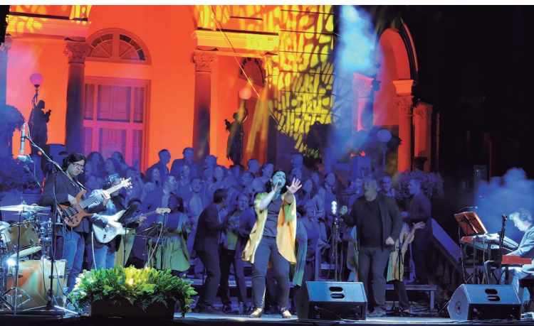
The Gospel Viu Choir va tornar a triomfar als Jardins del Cal Marquès.