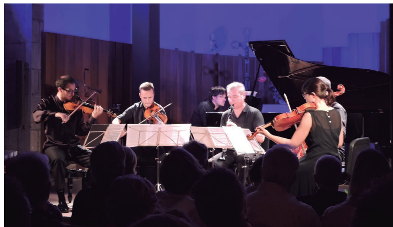
Músics en Residència inicia una nova etapa ara fora del Festival d'Estiu.