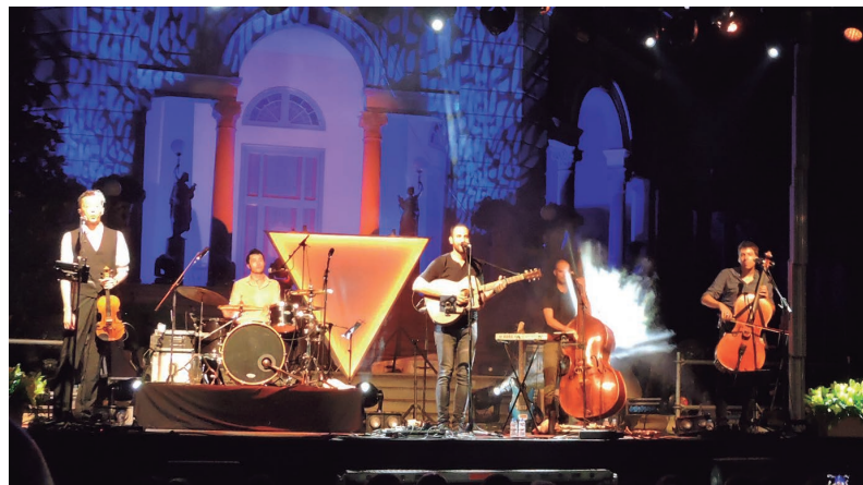
Blaumut va fer aixecar de les cadires al públic assistent al concert dels Jardins del Cal Marquès.