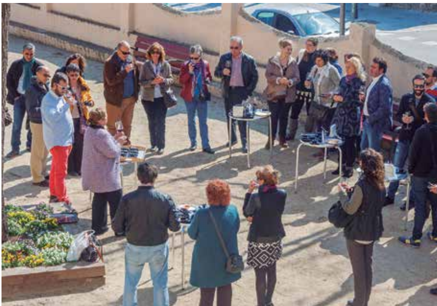
Al mes de març s'han programat dues sessions en anglès: l'English Mostast del 4 de març i l'English Enotast del dia 11.

L'English Enotast i l'ampliació de l'oferta de tapes + vi són les novetats d'enguany.