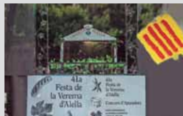
Premi popular: Tot Dolç