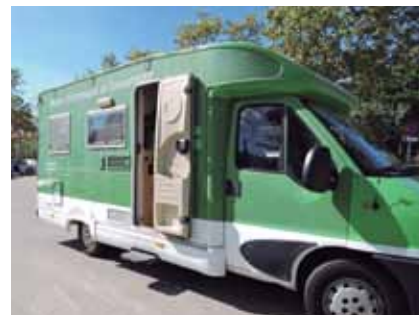
El Bus Consum visita Alella un divendres al mes.

Divendres 18 de desembre, de 10.30 a 13h