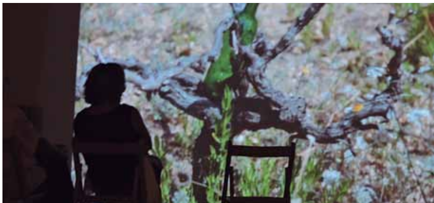
La exposició "El paisatge transmèdia" es pot visitar fins a l'11 d'octubre a Can Manyé.

Can Manyé manté oberta fins a l'11 d'octubre la proposta artística "El paisatge transmèdia", un projecte de Carlot Castell i Xavi Saucedo.