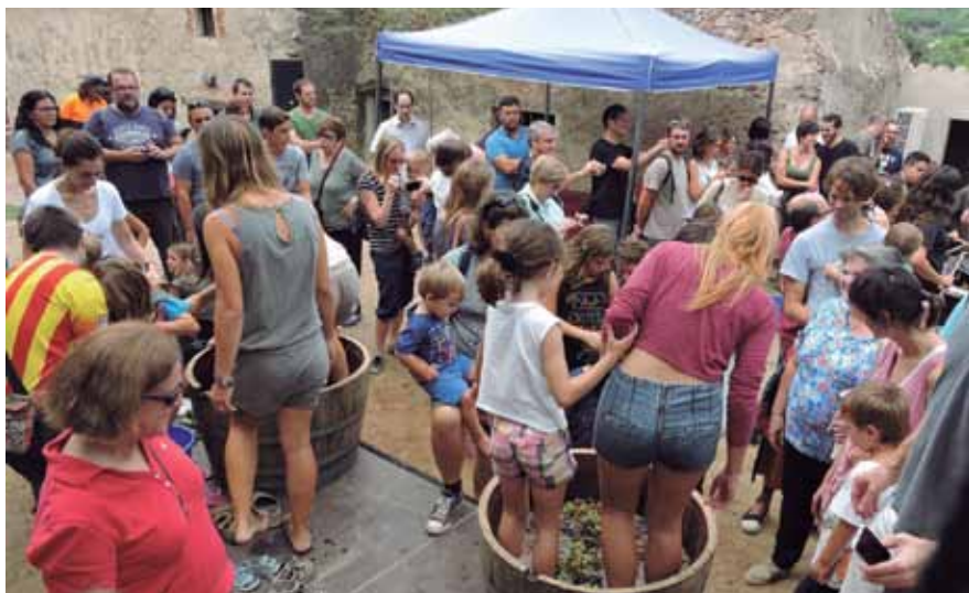
Grans i petits van gaudir de valent amb la trepitjada familiar de raïm a Can Magarola.

Força participació a les activitats i prop de 22.000 tiquets venuts a la Mostra Gastronòmica.