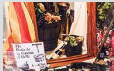
Primer premi: Charol