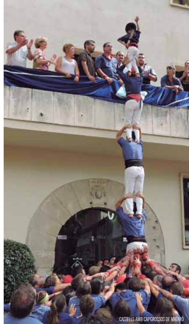
CASTELLS AMB CAPGROSSOS DE MATARÓ