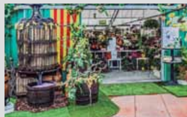
Segon premi: Agroalella