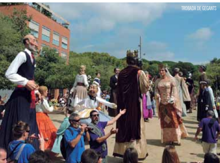
TROBADA DE GEGANTS