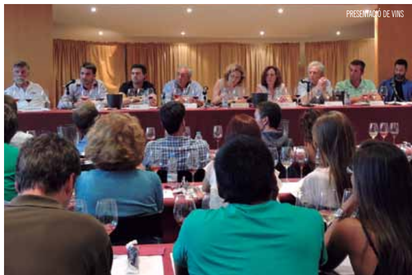
PRESENTACIÓ DE VINS