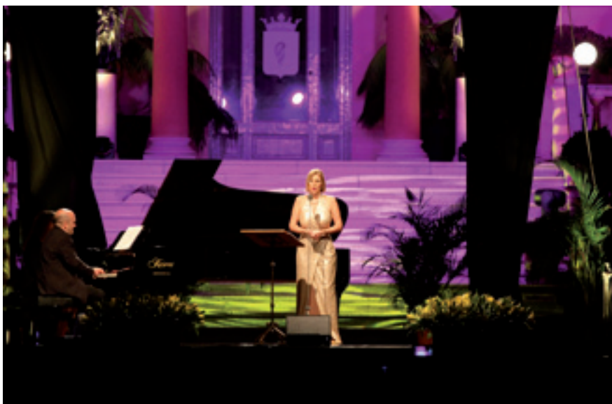
La soprano Ainhoa Arteta es va mostrar molt entusiasmada amb la bellesa de l'espai dels Jardins de Cal Marquès.