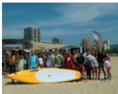
Sortida de surf i taller de percussió.

Les activitats adreçades a adolescents han tingut una bona acollida.