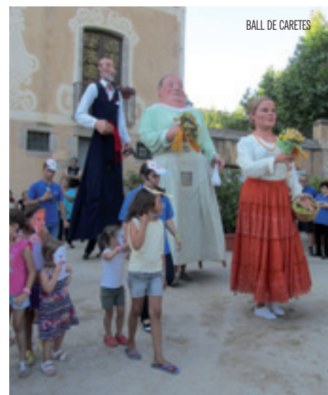
BALL DE CARETES