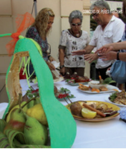
CONCURS DE PERES FARCIDES