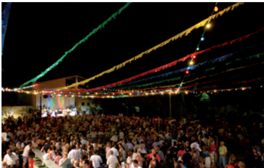
El gran ball de gala de l'Orquestra La Selvatana va ser un dels actes més concorreguts de la Festa Major.

Tot i l'amenaça de pluja que va haver-hi en alguns moments, els núvols