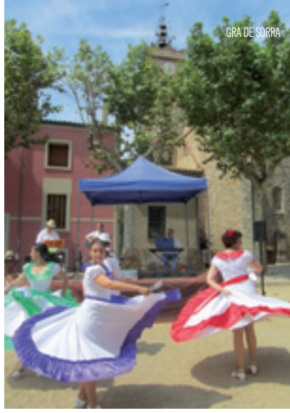
GRA DE SORRA