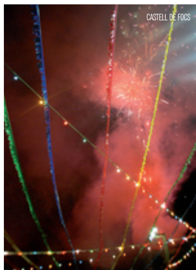
CASTELL DE FOC