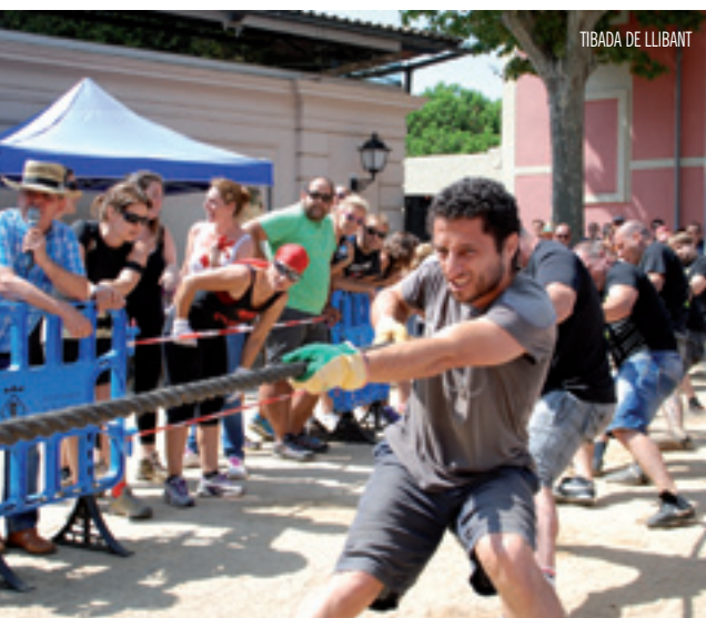
TIBADA DE LLIBANT