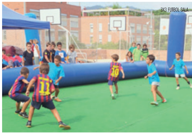
3X3 FUTBOL SALA