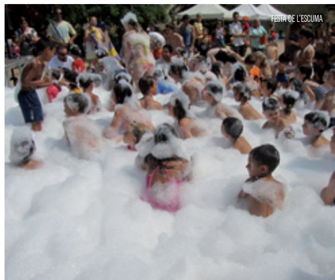
FESTA DE L'ESCUMA