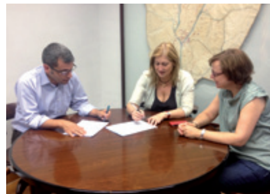
Signatura del conveni amb l'Institut Alella.

Les aportacions econòmiques de l'Ajuntament als centres educatius i les seves respectives AMPA ascendeixen enguany a 50.485€. Aquest és l'import derivat dels sis convenis de col·laboració que l'Ajuntament va signar el passat mes de juliol amb l'Escola Fabra, l'Escola la Serreta, l'Institut d'Alella i les AMPA dels tres centres educatius. Del conjunt de les subvencions 33.655€ són per als centres educatius i 16.830€ per a les AMPA. Els convenis de col·laboració concreten un seguit de compromisos de la comunitat escolar per millorar la qualitat educativa i estableixen la seva participació en les activitats que s'organitzen al municipi.