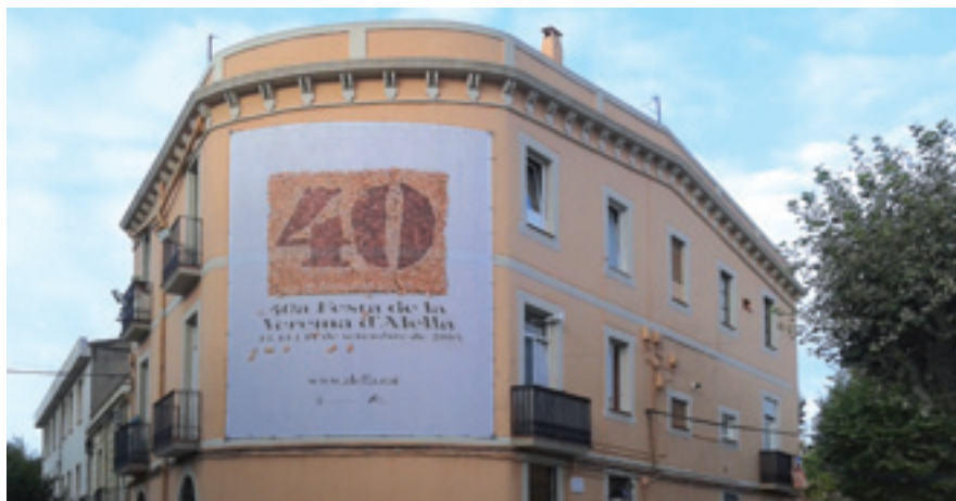
Un gran mural de 6x5 metres anuncia els 40 anys de la Festa de la Verema.

La Festa de la Verema celebra el seu 40è aniversari defensant els valors dels vins de la DO Alella.