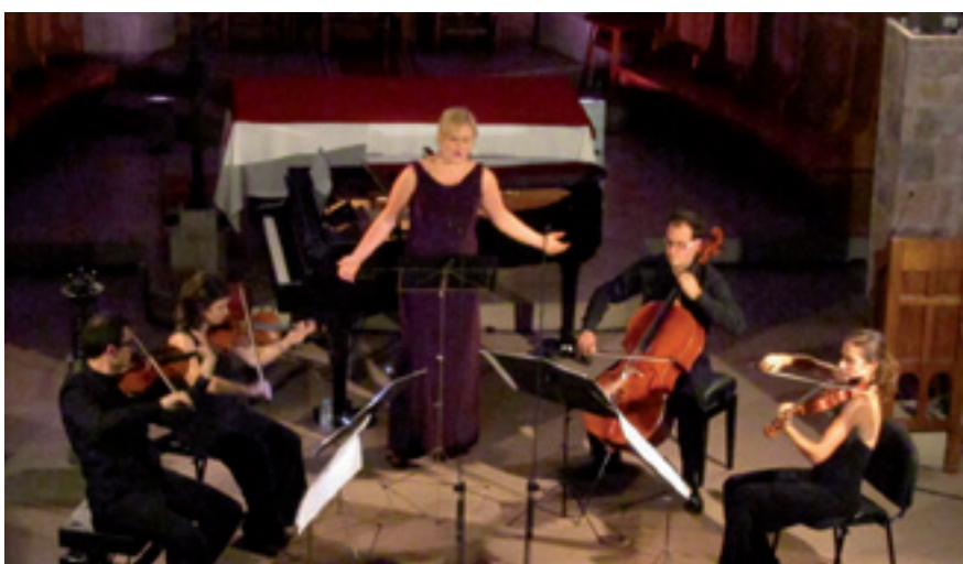
Els Músics en Residències van captivar el públic en els dos concerts que van oferir el 17 i 19 de juliol a l'Església d'Alella.