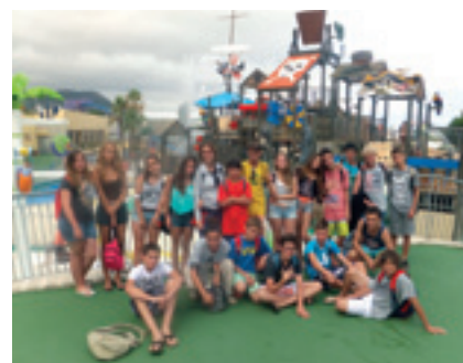
Sortida a Illa Fantasia i taller de clown