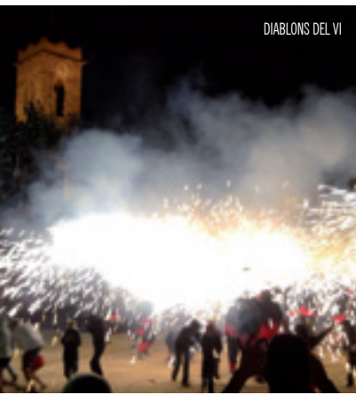
DIABLONS DEL VI