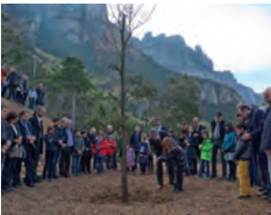
El roure es va plantar el 2 de març a Montserrat.

El Roure del Tricentenari arrela en terra d'Alella a la muntanya de Montserrat. El municipi ha posat el seu gratat de sauló, procedent de la vinya de Can Magarola, perquè arrela aquest arbre que es va plantar el 2 de març amb terra procedent d'arreu de Catalunya, com a símbol d'unitat i fermesa. L'Ajuntament va voler fer partícip a les entitats i tots el veïns i veïnes del poble d'aquesta celebració, amb l'objectiu que tothom pugui aportar el seu granet de sorra per aconseguir plegats el vigor