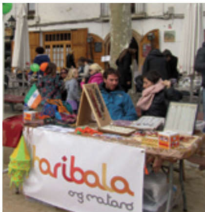
Imatge de la darrera edició.

L'Ajuntament destinarà aquest any 2013 un total de 37.600€ a finançar projectes de cooperació al desenvolupament que es duen a terme a diferents parts del món. Els ajuts procedeixen del 0,7% del pressupost d'ingressos ordinaris que es dediquen a cooperació internacional i es donen a través del Fons Català de Cooperació al Desenvolupament. A partir de la valoració realitzada per la Comissió de Cooperació Internacional, la Junta de Govern ha