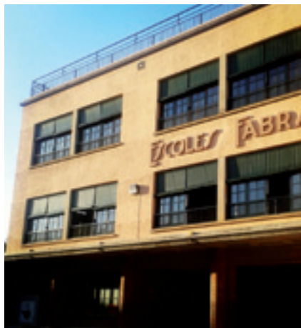
L'Espai Jove està instal·lat a les antigues Escoles Fabra.

L'Espai Jove, el nou equipament del jovent d'Alella, ha aprofitat el canvi d'emplaçament per posar en marxa