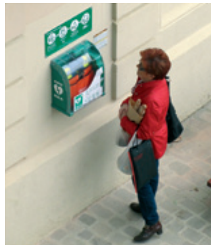
Desfibril·lador instal·lat a la Plaça de l'Ajuntament.

Els cinc aparells desfibril·ladors han estat llogats a l'empresa Technology 2050 SL per 535,79€ mensuals. L'import inclou la instal·lació i senyalització dels aparells, la posada en funcionament i el manteniment dels equips, així com les sessions formatives en tècniques de suport vital. La Policia Local disposava des de gener de 2009 d'un equip desfibril·lador instal·lat al cotxe patrulla que ara ha estat substituït per un de nou.