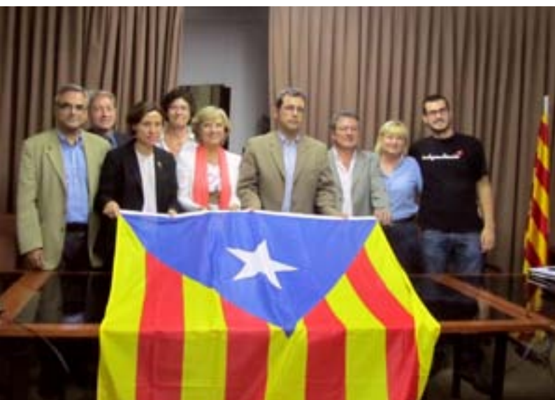
ERC+SxA i CiU van presentar una moció conjunta per la independència de Catalunya.

L'Ajuntament penja l'estelada a Can Leonart i demana al Parlament que enceti el procés per aconseguir la plena sobirania de Catalunya.