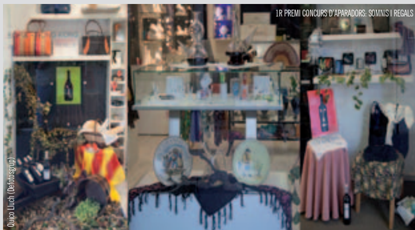
1R PREMI CONCURS D'APARADORS: SOMNIS I REGALS

Els establiments Somnis i Regals, La Cuina i Friselina han estat guardonats amb el 1r, 2n i 3r premi, respectivament, en el Concurs d'Aparadors de la 38a Festa de la Verema que cada any atorga l'Ajuntament. Enguany s'ha incrementat considerablement la participació amb un total de quinze aparadors aspirants.