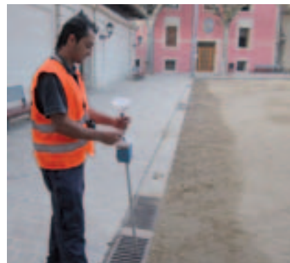
La darrera aplicació es va fer el 21 de setembre.

Amb aquest tractament es donarà per acabat el programa d'actuació a la via pública durant el 2012. L'Ajuntament recorda que per lluitar contra la