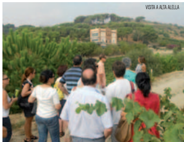
VISITA A ALTA ALELLA