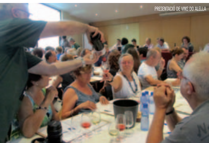
PRESENTACIÓ DE VINS DO ALELLA