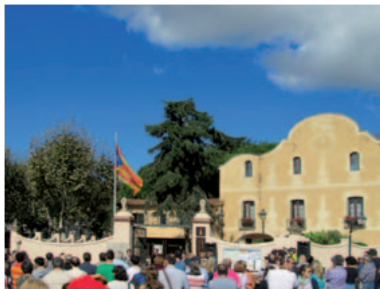
A l'acte d'hissada de l'estelada a Can Leonart van assistir unes 200 persones.

El Ple de l'Ajuntament va declarar el municipi d'Alella territori català lliure en una moció per a la declaració d'independència de Catalunya aprovada el 27 de setembre amb els vots a favor d'ERC+SxA i CiU, l'abstenció de Gd'A i el vot en contra del PP i del PSC.