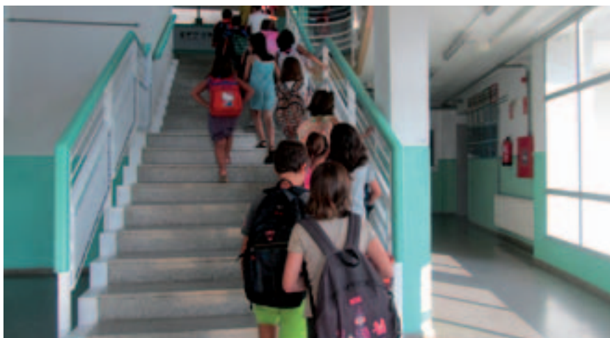
Primer dia de classe a l'Escola Fabra.

Més d'un miler d'alumnes comencen el curs als centres públics de segon cicle d'infantil, primària i secundària.