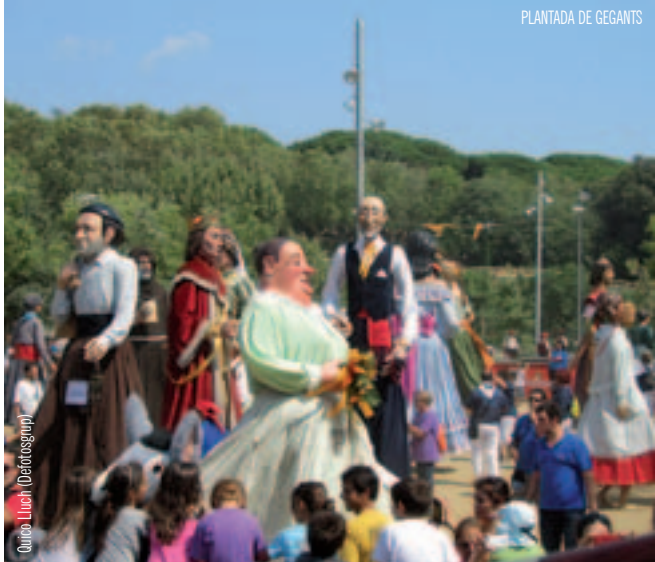
Quico Luch (Photography)