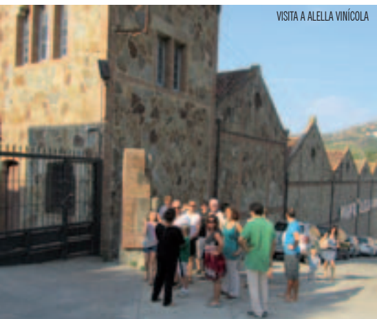
VISITA A ALELLA VINÍCOLA