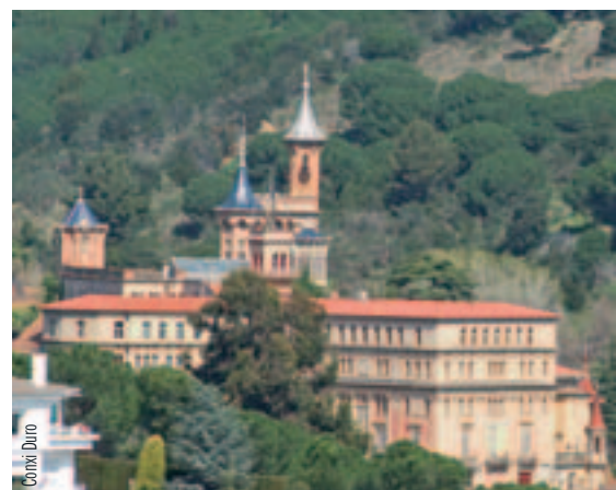
Imatge dels Escolapis presa l'any 2006.

L'Ajuntament ja fa temps que treballa per trobar-ne una sortida viable, però els esforços realitzats no han donat, de moment, els resultats desitjats. Davant del progressiu estat de degradació de la finca, el juliol de l'any passat es va acordar crear una Comissió de treball amb l'objectiu d'impulsar actuacions per tal de preservar i donar viabilitat a