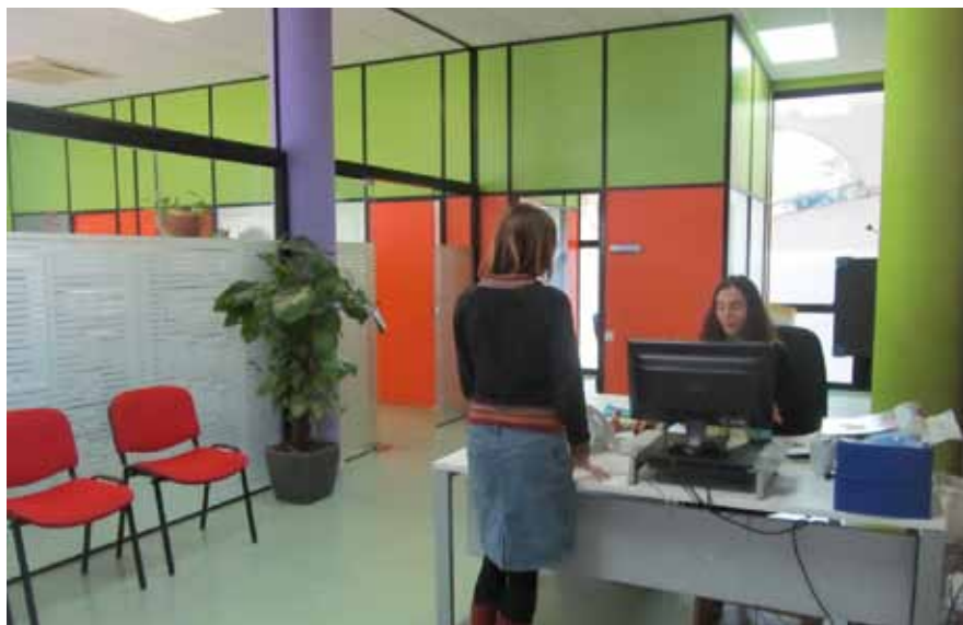
Les oficines de Serveis Socials estan ubicades des de fa dos anys a l'edifici municipal del Torrent Vallbona.

L'equip de Serveis Socials de l'Ajuntament va fer prop de 2.000 intervencions professionals al llarg de 2011.