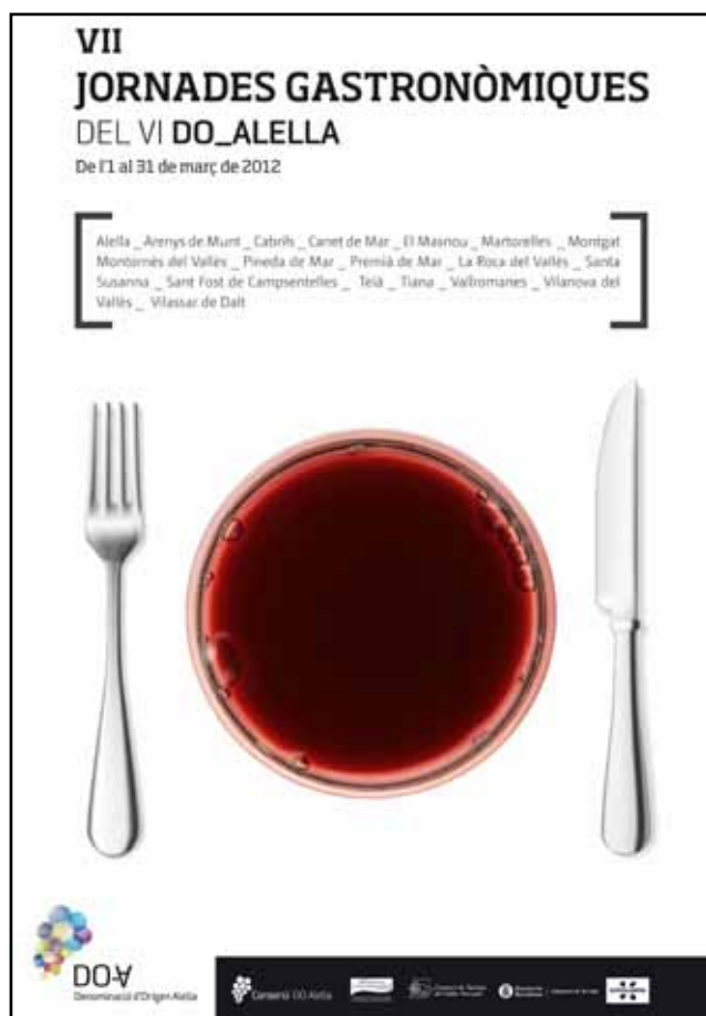
Les Jornades Gastronòmiques del Vi DO Alella se celebren de l'1 al 31 de març.

Les setenes Jornades Gastronòmiques del Vi DO Alella passen de 15 a 31 dies i s'estenen a 18 municipis del Maresme i el Vallès Oriental.