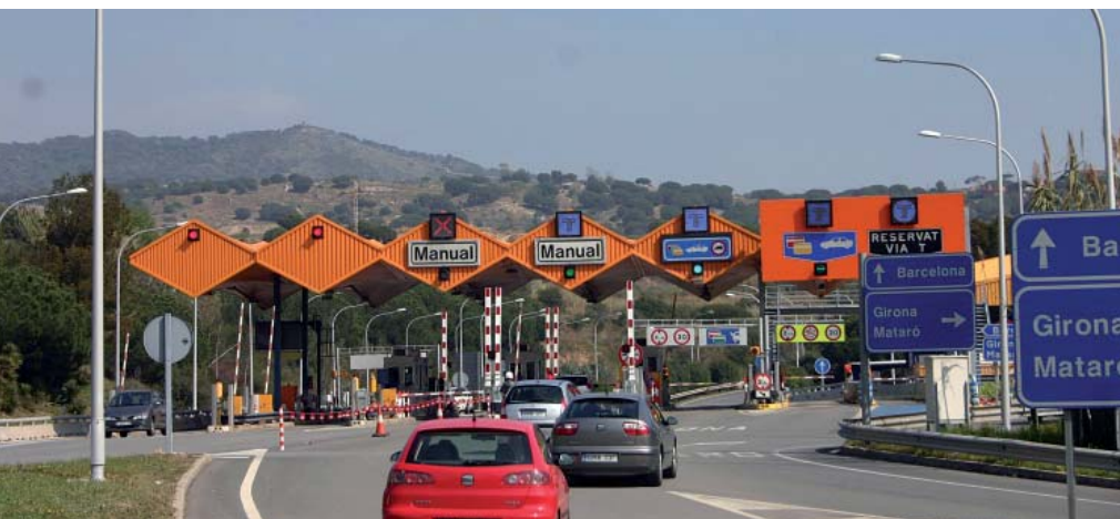
La Generalitat ha decidit suprimir la bonificació del 100% per a més de vuit desplaçaments a l'accés d'Alella de la C-32.

La Generalitat elimina l'exempció de pagament per vuit o més trànsits mensuals que s'aplica a l'accés d'Alella de la C-32 des de 2007.