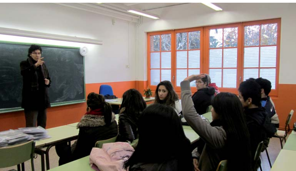
Els alumnes de PQPI van fer una visita al centre i al municipi el passat 20 de desembre.

Una dotzena d'alumnes comencen aquest mes la seva formació professional d'auxiliar de vendes i atenció al públic.