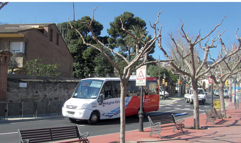
El bitllet senzill costa a partir d'ara 2 euros i la T-10 9,25 euros.

L'Ajuntament d'Alella congela el preu de T-10 social per a les línies urbanes que es manté en 6,80 euros.