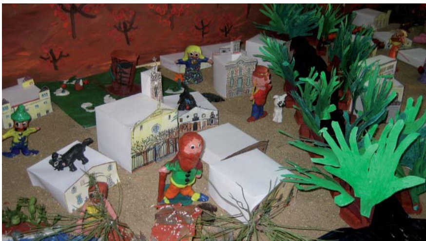
El pessebre de l'Escola Fabra va guanya el primer premi de la categoria d'Escoles.