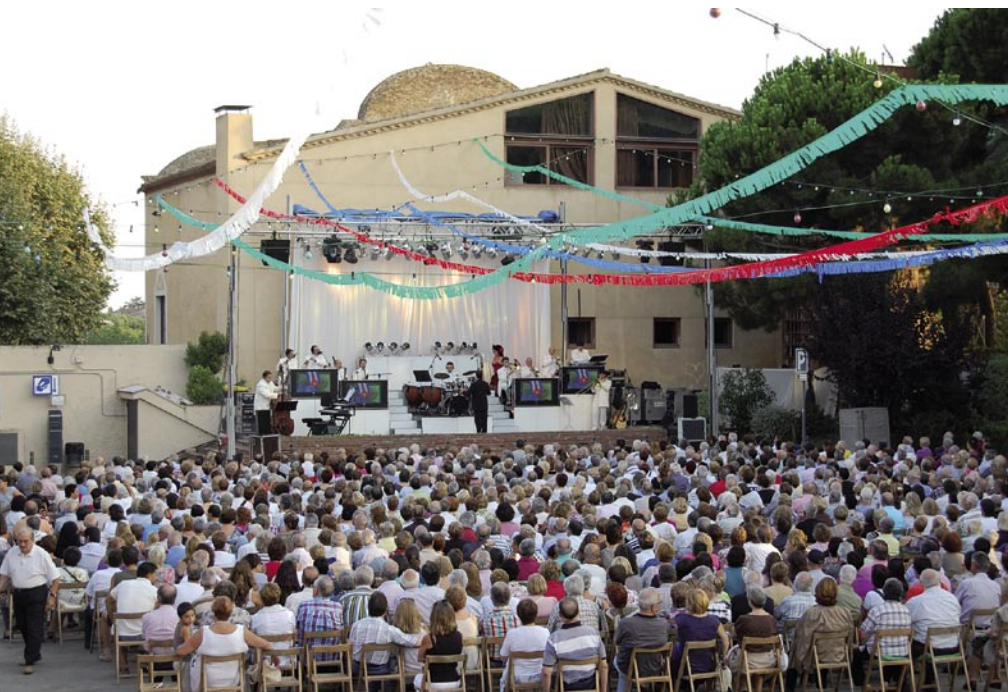
Concert de l'orquestra Selvatana a l'Hort de la Rectoria.

La pluja no aconsegueix deslluir la celebració que s'acomiada amb un balanç molt positiu de participació.