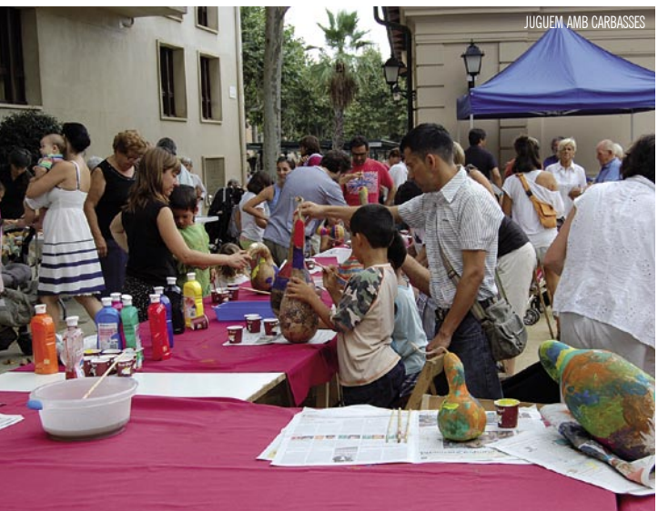
JUQUEM AMB CARBASSES