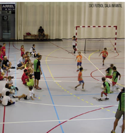
3X3 FUTBOL SALA INFANTIL