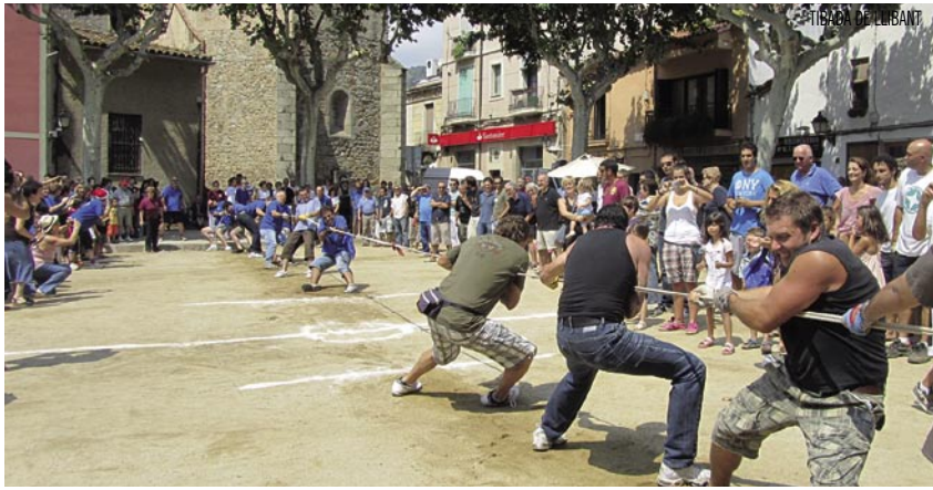
PISTOLA DE LUBANA