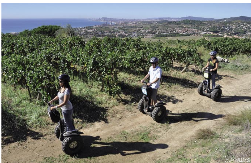
Passeig en segway per les vinyes, en la 1a edició de la Setmana del Vi.

El mapa de les jornades ha canviat de forma radical. Si a la primera edició les activitats es van centrar a Alella, el Masnou i Teià, enguany s'han afegit 10 municipis més: La Roca del Vallès, Martorelles, Montornès del Vallès, Pineda de Mar, Premià de Mar, San-