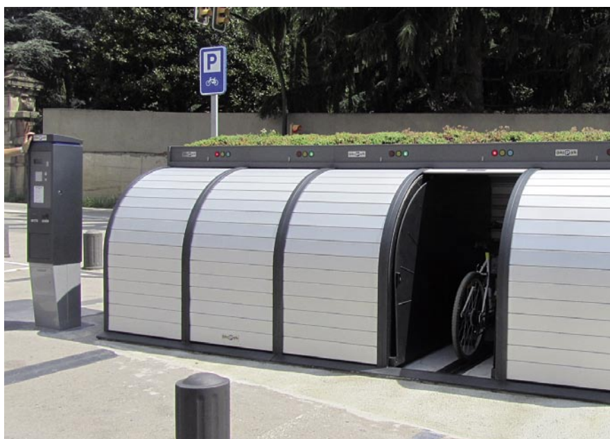
El 'bike-park' es va posar en funcionament el 28 de juliol i serà gratuït fins a començament d'octubre.

L'Ajuntament posa en marxa un aparcament segur per a bicicletes a l'estacionament de Can Lleonart