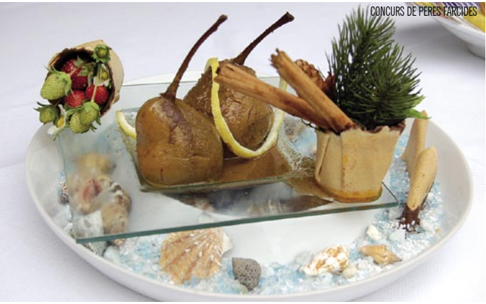
CONCURS DE PERES FARCIDES