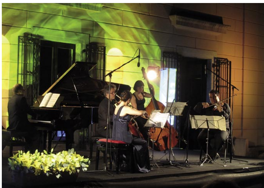
Concert de Músics en Residència, als Jardins de les Quatre Torres.

El Festival d'Estiu Alella 2011 es va acomiadar el 23 de juliol amb l'últim dels dos concerts programats de 'Músics en Residència'. A l'escenari del Jardí de les Quatre Torres, la quinzena de músics que han participat en l'edició d'enguany van transmetre al públic les bones vibracions que genera la complicitat adquirida després de nou dies de convivència i treball conjunt. Prop de 600 persones van assistir als dos concerts programats. Els concerts són la culminació d'un projecte que va molt més enllà i que pretén apropar la música a la ciutadania a través dels assajos oberts al públic. Les audicions, que s'han fet a Can Lleonart i l'escola Ressò, han tingut una bona resposta per part del públic que ha pogut fer un seguiment constant del treball dels músics.