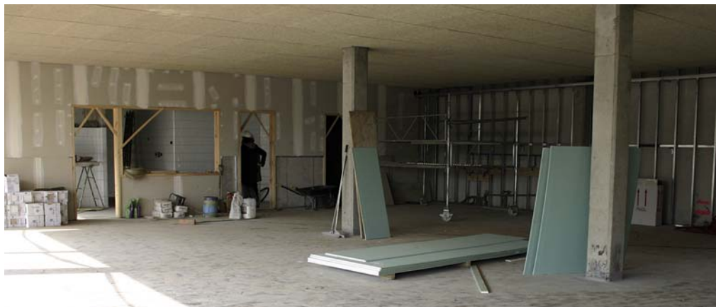
Sala de menjador de la nova escola de la Serreta.

Els responsables territorials d'Educació van explicar que no s'obligarà als alumnes matriculats al Fabra a canviar de centre, sinó que les famílies que ho desitgin podran canviar voluntàriament de centre, tot i que van insistir en la necessitat que l'escola Fabra s'adeqüi progressivament a una dimensió prevista per a dues línies o aules per curs. Les preinscripcions per als dos centres -Fabra i la Serreta- es faran a l'escola Fabra (consulteu l'horari en el quadre).