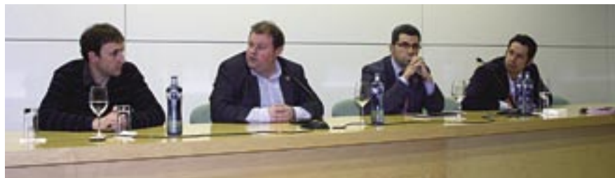
L'alcalde d'Alella amb el Director General de l'Incavi i els ponents d'enoturisme de les DO Priorat i Empordà.

L'alcalde va exposar els projectes d'enoturisme del territori DO.