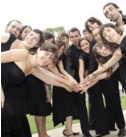
Conjunt XXI! Simfonisme de cambra.

El cicle de música clàssica de Can Lleonart inclou tres propostes molt diferents per gaudir de la música de cambra. La primera cita arriba el 5 de novembre amb la del B3 Clàssic Trio,