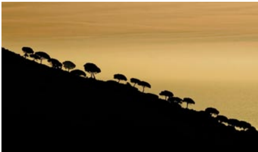
Foto guanyadora del premi extraordinari del III Concurs de Fotografies del Parc Serralada Litoral, de Carlos Castillejo.

Can Lleonart acull el lliurament de premis del III Concurs de Fotografies.