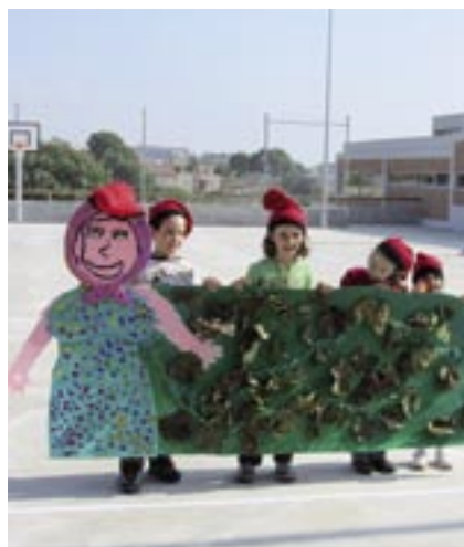
La primera imatge de la Cuca Serreta.

L'AMPA organitza una festa de benvinguda a la nova escola.