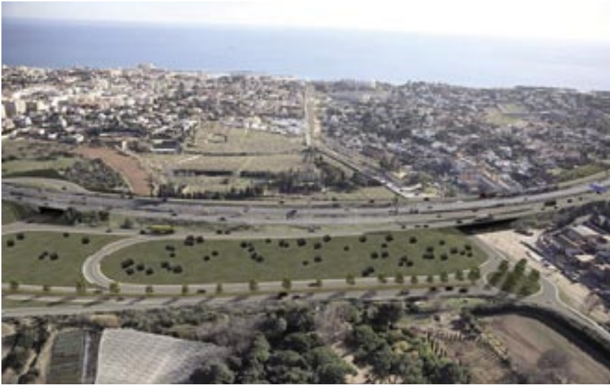
Imatge virtual de l'enllaç d'Alella.

La nova carretera de quatre carrils aniria paral·lela a la C-32 i comportaria la supressió del peatge d'Alella.