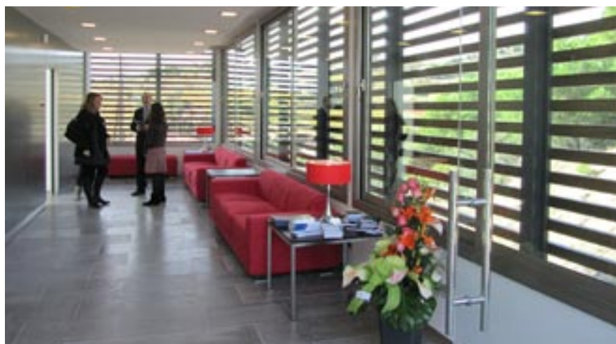
A dalt, exterior i interior del nou tanatori. A baix, imatge virtual de com quedarà l'accés al cementiri un cop arranjat.