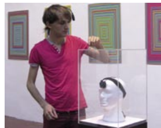
Neil Harbisson a l'exposició de Can Manyé.

L'exposició Sonocromatisme. L'art d'escoltar colors , de Neil Harbisson, instal·lada a Can Manyé del 7 al 24 d'octubre, ha despertat un gran interès del públic i els mitjans de comunicació d'abast comarcal i nacional.