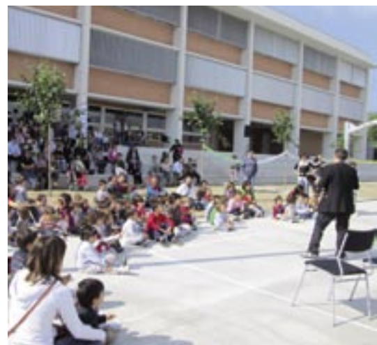
La festa va concloure amb un espectacle de màgia.