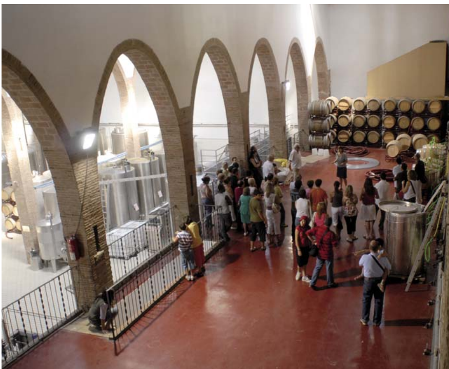
Una visita guiada en anglès al celler Alella Vinícola és una de les novetats d'enguany.

La proposta Tapes + Vi , la visita guiada en anglès a un celler de la DO i la primera cursa de la Verema són algunes de les novetats del programa d'enguany.