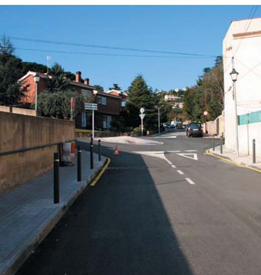
Pavimentació del passeig Aymar i Puig.

Recentment, ATLL ha enllestit els treballs de reposició de les obres corresponents a la connexió de la xarxa general entre Alella i Tiana. En concret i d'acord amb les condicions estipulades per l'Ajuntament, ATLL ha dut a terme la pavimentació i senyalització viària del passeig dels Germans Aymar i Puig i del carrer del Doctor Homs, la instal·lació d'un sistema de recollida d'aigües pluvials, l'eixamplament de la vorera i la construcció d'un giratori davant de Cal Baró.