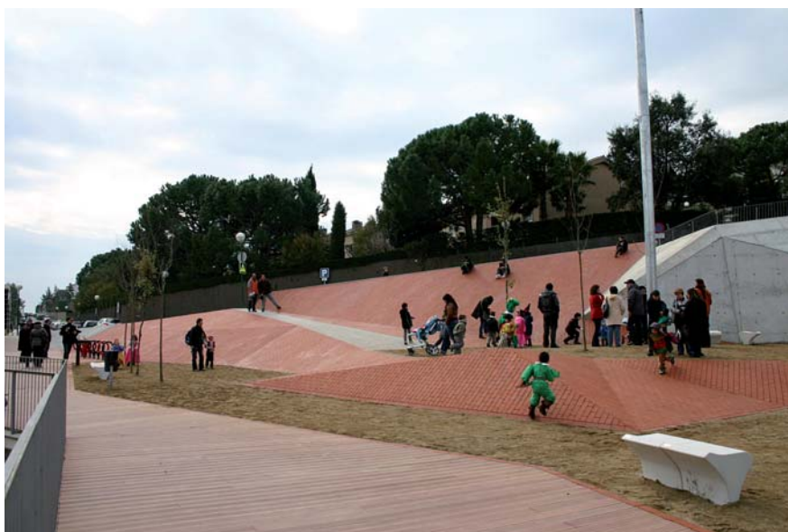
El nou espai és un lloc de pas i estada que uneix el Poliesportiu i el Complex Esportiu Municipal.

El nou espai és un lloc d'estada i lleure, a més d'un bon mirador per les activitats que es realitzen a la pista exterior del Poliesportiu. El disseny de la urbanització i el mobiliari que s'ha instal·lat tenen un estil molt modern i