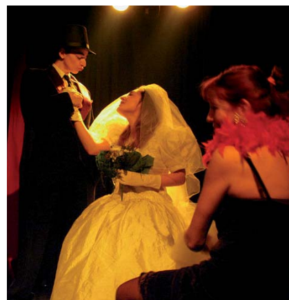
Representació teatral ' La parella ideal '.

L'Associació Dones Solidàries, per la seva part, repartirà flors solidàries pels diferents comerços del centre urbà el 8 de març.