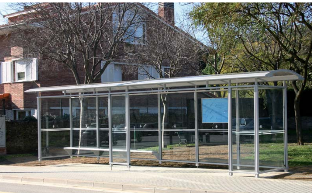
La nova marquesina de la parada de Can Leonart triplica la capacitat de l'anterior

S'ha col·locat una nova marquesina a Can Leonart i bancs a la resta de parades.