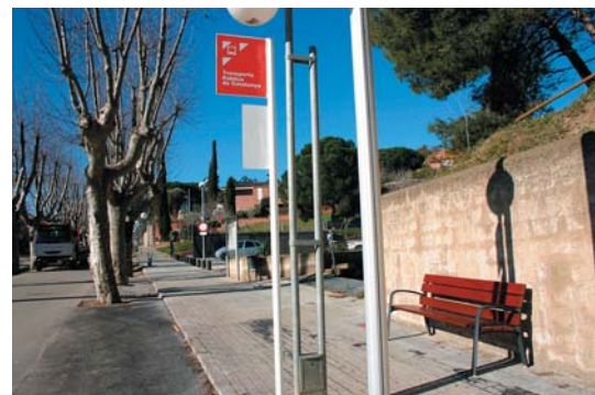
Arranjament de la parada de la Policia Local.

Aquest servei substitueix l'antic Alella-Teià i uneix els nuclis d'Alella Parc, Mas Coll, Can Comulada, Mar i Muntanya, La Gaietana i Montals amb l'estació del Masnou. La suma dels viatgers alellencs de l'Alella-Teià i de l'Alella Circumval·lació ascendeix a 49.509.