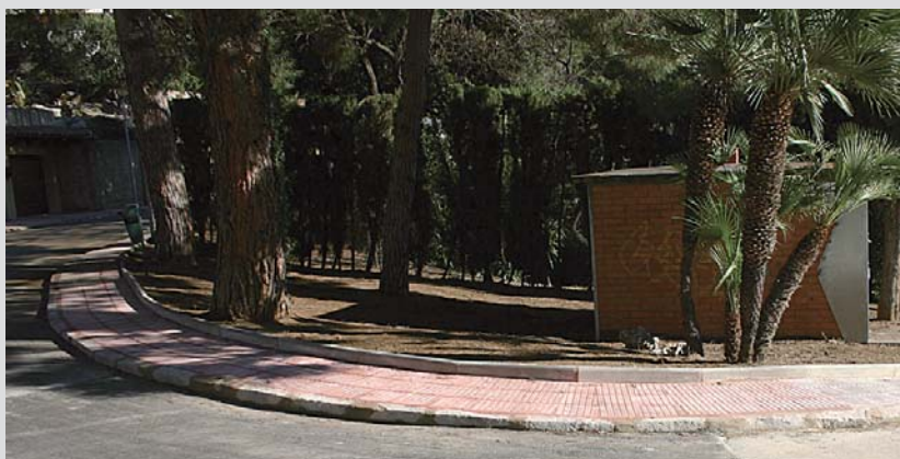
Entre d'altres actuacions, s'ha arranjat la zona verda i s'ha refet la vorera.

L'Ajuntament ha executat aquest mes de febrer obres de reparació i arranjamet del paviment en diferents carrers que estaven en mal estat. L'actuació s'ha dut a terme als carrers d'Onofre Talavera -a l'encreuament amb la plaça del Safareig i Dolors Riera-, Molí, Cep, Greny -amb Ramon Bereguer III i Martí l'Humà-, Gifré el Pilós i Bernat I Tallaferro. Al carrer d'Onofre Talavera també s'ha reposat la vorera i s'han fet treballs de neteja de la zona verda de la plaça del Safareig.