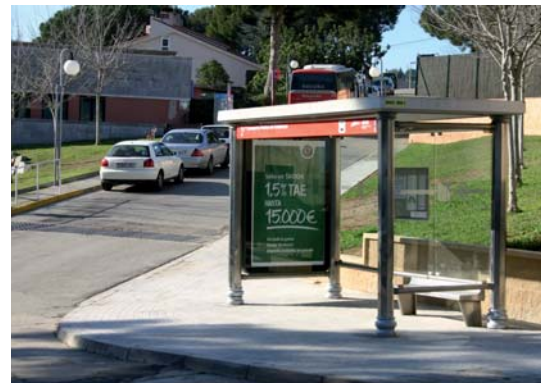
Marquesina de la parada del Torrent Vallbona.