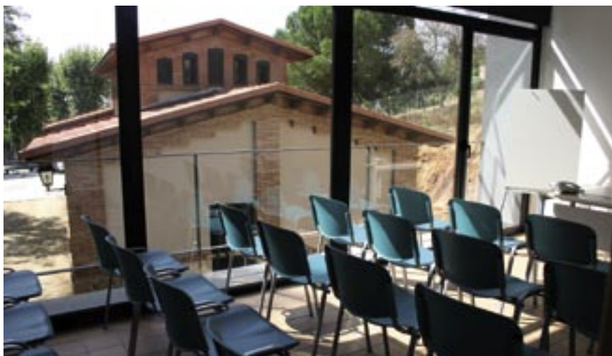
L'edifici de nova construcció acull una sala polivalent amb capacitat per a una trentena de persones.

La remodelació de l'antic escorxador ha comportat, entre d'altres actuacions, la consolidació de les estructures i l'eliminació de les humitats, l'ampliació de les entrades de llum natural, la neteja i restauració de les peces de pedra, l'aïllament exterior, així com la renovació de la coberta. El resultat és un espai de 150 m 2 amb planta baixa i altell. En la planta baixa està situada la recepció i l'oficina de recepció de denúncies, que són els espais d'atenció a la ciutadania. A més, hi ha la sala dels caporals, el despatx del regidor de