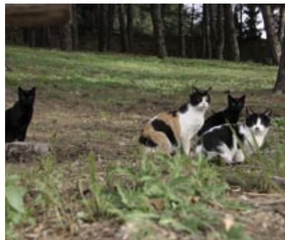
Colònia de gats establerta al costat de l'escorxador.

Amb l'objectiu de trobar-los una nova llar, ADANA organitza els dies 28 i 29 de novembre una passejada de gossos a la rambla d'Àngel Guimerà, al costat de la Porxada. La protectora muntarà parades amb articles de segona mà per recaptar fons.