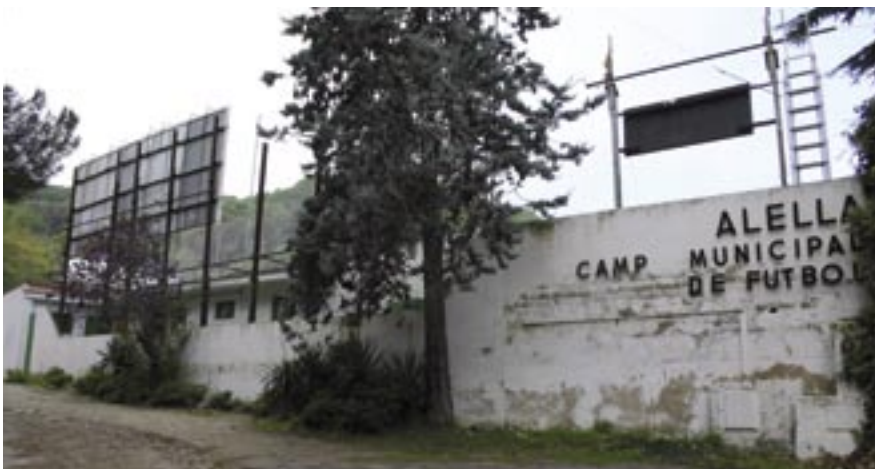
Els actuals vestidors del camp de futbol estan en mal estat i seran substituïts per un edifici modular.

mal estat dels vestidors. De fet, existia un projecte de l'any 2002 per fer-ne uns de nous, si bé el Club de futbol va acabar prioritant, el 2004, la instal·lació de gespa artificial.