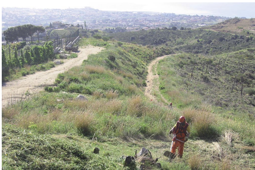
La mesura està adreçada a reduir el risc de propagació dels focs als habitatges en cas d'incendi forestal.

S'han iniciat els treballs de manteniment de les franges perimetrals de protecció contra els incendis a Nova Alella-Cal Baró, Can Comulada, Mas Coll, Alella Parc, Font de Cera i Can Magarola.