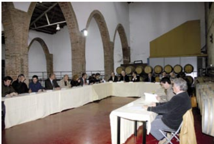
La signatura del conveni va tenir lloc al celler Alella Vinícola Can Jonc.

Divuit ajuntaments del Maresme i el Vallès Oriental, sis cellers i el Consell Regulador de la DO Alella han signat un conveni de col·laboració per a la promoció del vi de la Denominació d'Origen.