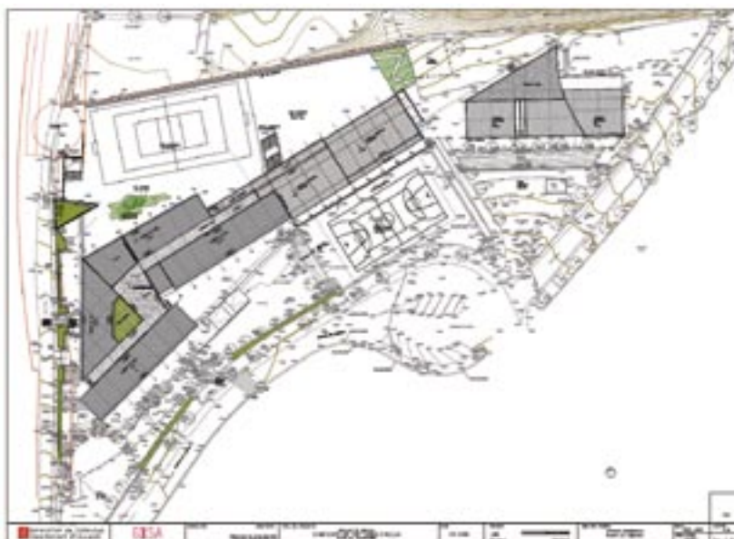
Les obres ampliaran de 8.000 a prop d'11.000m 2 la superfície total del centre.

petits grups) se situaran en planta pis a la façana nord i nord-est. Pel que fa a l'edifici d'infantil, l'ampliació incorpora una sala auxiliar per a petits grups, una tutoria i una sala de professors.