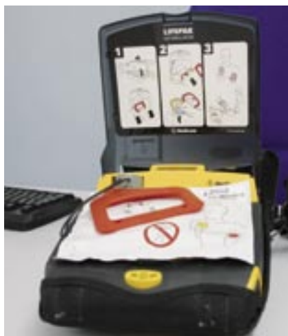
La Policia Local d'Alella és una de les primeres de Catalunya que s'ha dotat d'un desfibril·lador

Els agents porten l'aparell, que està homologat i reconegut pel Departament de Salut de la Generalitat, al cotxe patrulla per donar una resposta al més ràpida possible. Per fer servir el desfibril·lador els agents han rebut la formació preceptiva i disposen d'un