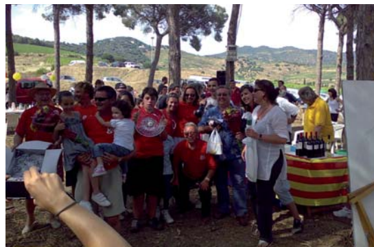
Gent d'Alella a l'Aplec de l'Arròs: la il·lusió per la feina ben feta.

Permeteu-me felicitar als membres de Gd'A que han fet possible el primer (i quart) premi a l'Aplec de l'Arròs i manifestar-vos la nostra alegria. Que sigui un símbol de la feina feta des de la il·lusió i del triomf que la Gent d'Alella pot assolir amb la feina ben feta.