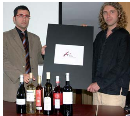
L'alcalde i el creador de la marca, amb una mostra de vins de la Denominació d'Origen Alella.

L'Ajuntament ja està treballant en l'elaboració de material turístic amb aplicacions de la marca, com ara una nova web, plànols del municipi, panells, venecianes i fulletons turístics. La marca estarà present en el material promocional del Centre d'Acollida Turística (CAT) que va ser inaugurat el passat 20 de juny.