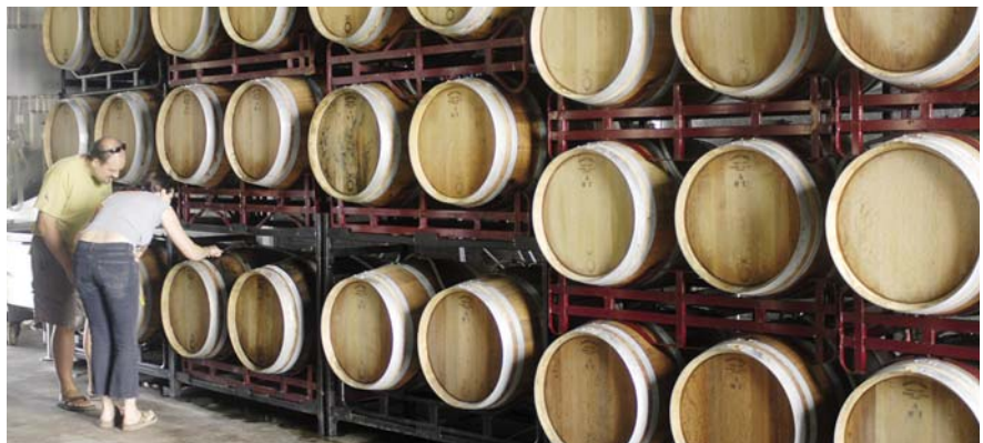
Les classes s'impartiran a l'IES Alella i les pràctiques es faran a Can Magarola i als cellers de la DO Alella.

Es tracta d'un ensenyament reglat, orientat al món del vi, que pretén formar els estudiants per a la seva incorporació qualificada al món laboral relacionat amb coneixements comercials i de màrqueting enològic i enoturisme, i