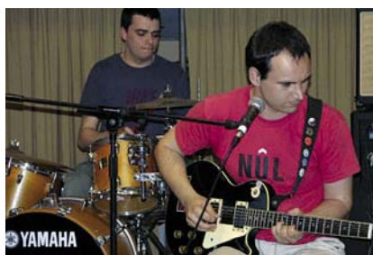
El grup alellenc èrase, guanyador de l'edició de 2007.

passaran a la fase final. Els grups finalistes actuaran dissabte 20 de juny en un concert al Masnou. En acabar, es farà públic el veredict. Hi haurà premis tant per als finalistes com per als guanyadors. Consulteu les bases de la convocatòria a www.alella.cat .