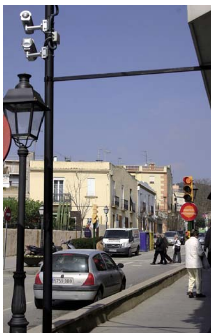
La mesura pretén garantir la seguretat dels vianants.

Aquesta situació ha motivat que l'adjudicació hagi estat revocada i que finalment s'hagin facturat 18.000 euros més IVA.