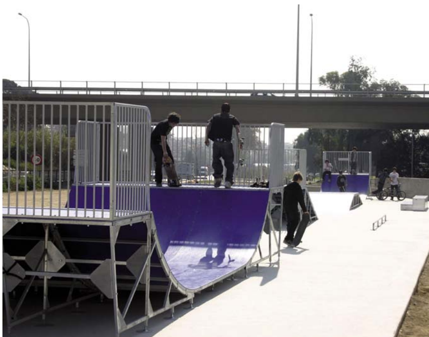
La pista va quedar enllestida a mitjans de març.

El parc de patinatge està adequat per a la pràctica de monopatins, patins en línia i bicicletes BMX.