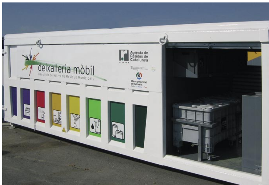
La deixalleria mòbil s'instal·larà la segona setmana de cada mes a la Riera Principal, entre Can Vera i Charles Rivel.

Pel seu volum i capacitat d'emmagatzematge, la deixalleria mòbil disposa de compartiments per recollir oli domèstic i