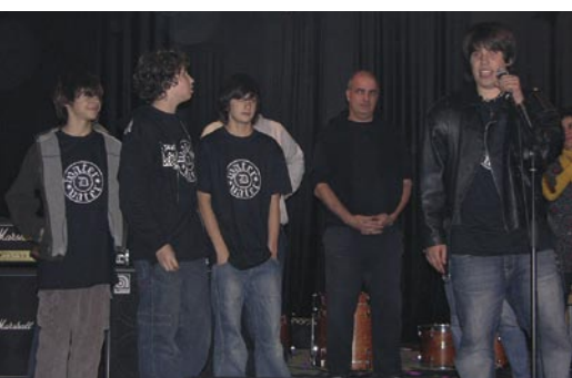
Els grups guanyadors Èrase (a dalt), i Water D Vàter (a baix).