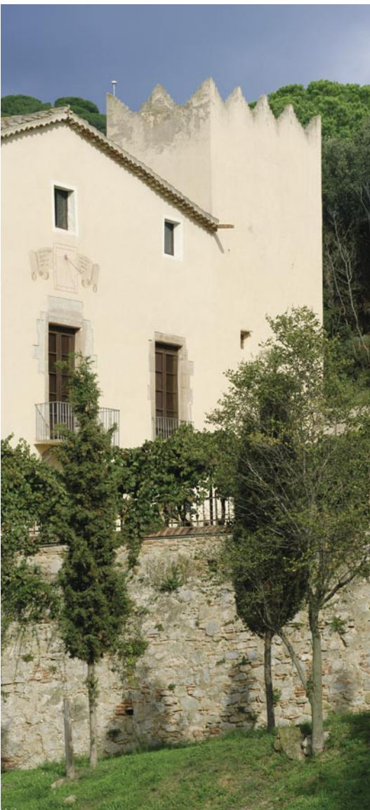
La Masia Museu Can Magarola està tancada al públic des de desembre de 2004.

Els diners, procedents d'una subvenció de l'Estat, es destinaran a obres de consolidació i reforç d'estructura que permetran millorar el seu estat de manteniment.