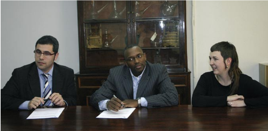
L'alcalde d'Alella, el representant del GRAMC i la regidora de Serveis Socials.

L'Ajuntament ha signat un conveni de col·laboració amb els Grups de Recerca i Actuació amb Minories Culturals i Treballadors Estrangers (GRAMC) per portar a terme diferents accions i activitats que afavoreixin la igualtat d'oportunitats i la integració social de les persones nouvingudes, procedents d'altres països i cultures. El programa d'acollida arrencarà aquest mes