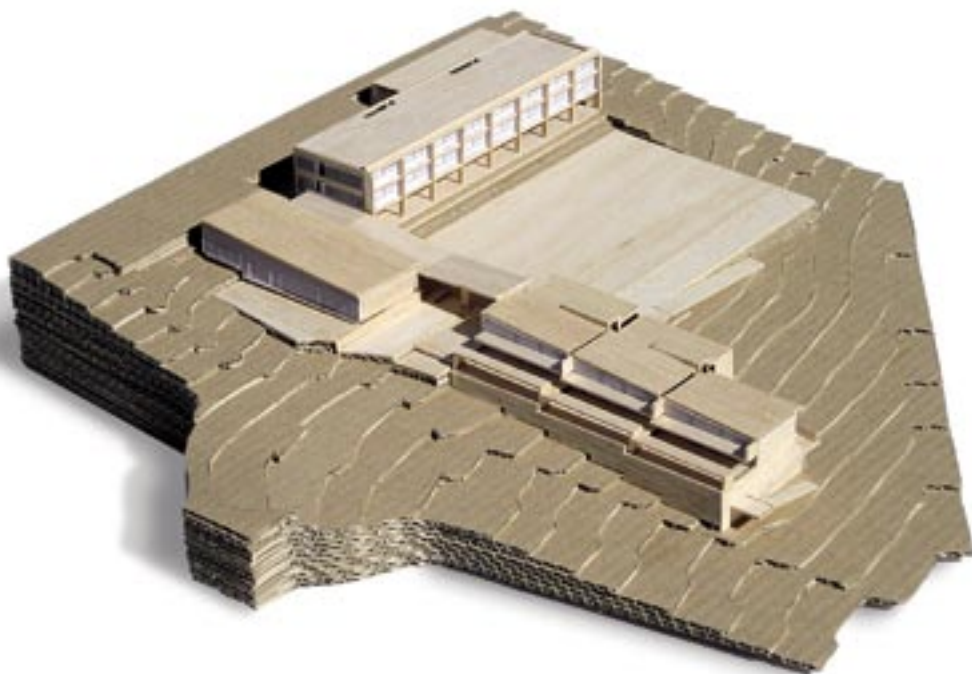
Maqueta de la nova escola

L'escola tindrà tres accessos: un pel carrer Núria, un altre pel carrer de la Vinya i un tercer, que serà l'entrada habitual de l'alumnat, situat a la part inferior del solar en un vial pendent d'urbanitzar. A l'entrada hi haurà un gran porxo que separarà la part de l'escola destinada als alumnes d'infantil de les classes de primària. L'accés pel carrer de la Vinya està pensat perquè pugui