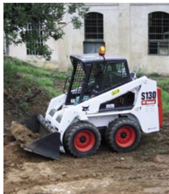
La brigada fa pràctiques amb la mini carregadora.

Abans de posar-la en servei, el personal de la brigada ha fet pràctiques per familiaritzar-se amb el funcionament de la màquina. L'adquisició d'aquest nou vehicle forma part de la política de renovació progressiva de la maquinària municipal promoguda des de l'àrea de Serveis Urbans.