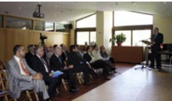
Trobada d'alcaldes i regidors a Can Lleonat.

Alcaldes i regidors de Promoció Econòmica dels 18 municipis que formen part de la Denominació d'Origen Alella van assistir el 3 d'octubre a la trobada organitzada per l'Ajuntament per posar en comú experiències de promoció del vi i de la vinya, que ja estan desenvolupant, i les possibilitats de promoció turística que els dóna aquest valor afe-