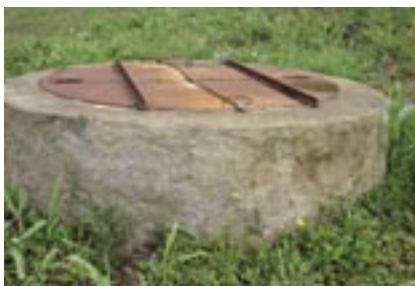
Un dels pous que es recuperarà a Alella Parc

L'empresa Sorea, concessionària del servei d'abastament d'aigua a Alella, ja ha iniciat els treballs que han de permetre l'aprofitament de l'aigua de pous i mines de titularitat municipal. Està prevista la recuperació de sis pous i dues mines i s'estima que l'activació d'aquestes captacions en desús aportaran a la xarxa d'abastament d'aigua 360.000 m 3 anuals, la qual cosa re-