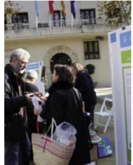
Presentació pública dels projectes de l'any passat

L'Ajuntament ha decidit subvencionar amb 4.000€ el projecte de rehabilitació de l'Àrea d'Hospitalització i Con-