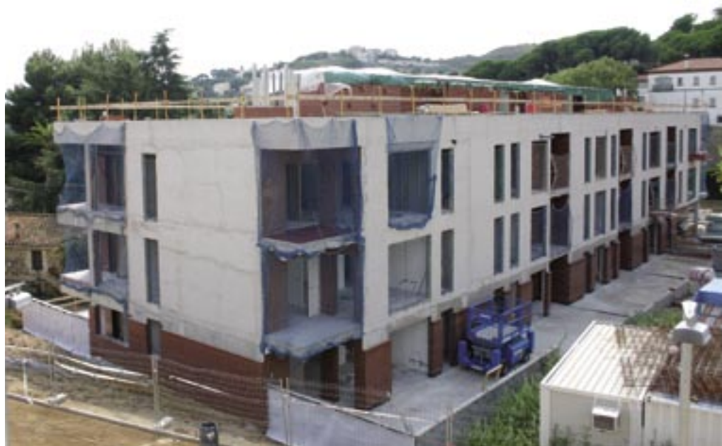
Les obres estan molt avançades i s'espera que estiguin enllestides el mes de juny.