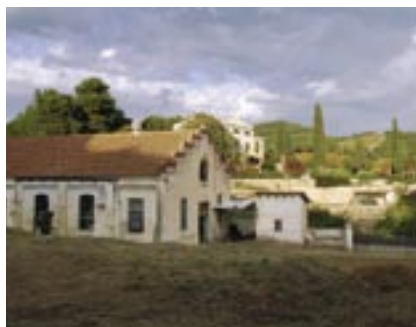
La Fàbrica de Pintures acollirà la futura biblioteca.

La Diputació aportarà en tres anys 359.000€ al finançament de dos importants equipaments d'Alella: el nou