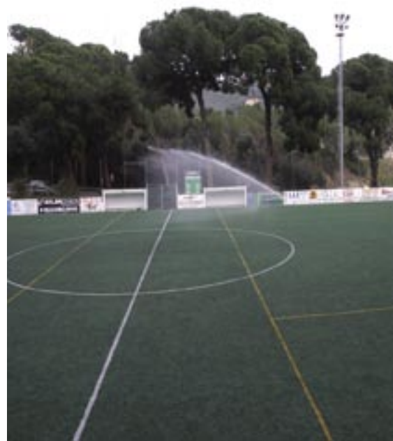
El camp reaprofita l'aigua de pluja i de reg.

La sequera i les mesures excepcionals decretades per la Generalitat que prohibeixen l'ús de l'aigua potable per al reg de parcs, jardins i zones esportives pot dificultar la pràctica de futbol als camps de gespa, natural o artificial, ja que si aquests no es reguen regularment es poden fer malbé i incrementar el risc de lesions dels jugadors.