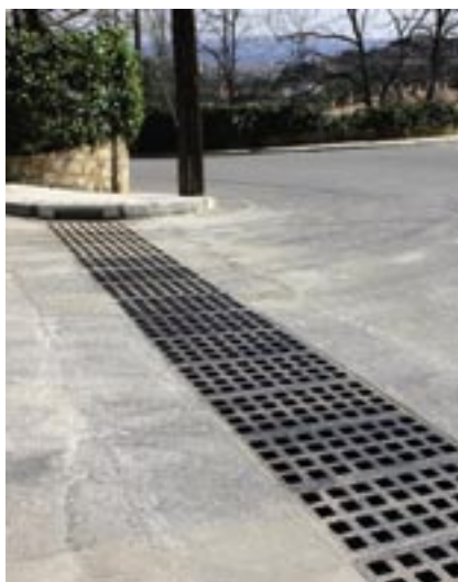
Les noves reixes de drenatge de la confluència de l'avinguda del Mil·lenari amb el carrer Perdius.

del carrer Perdius i l'avinguda del Mil·lenari. Aquesta darrera actuació ha quedat enllestida el mes de març amb un cost d'execució de 6.293€.