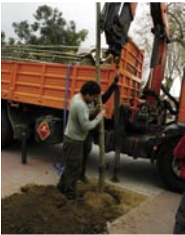
Uns operaris reposen un nou exemplar de plàtan a la rambla Àngel Guimerà.

L'Ajuntament ha reposat durant el mes de març l'arbrat viari que s'havia retirat per malaltia o per afectació d'obres. En concret s'han plantat 15 nous exemplars de plàtan a la Riera Fosca, la rambla d'Àngel Guimerà i a l'accés del Canonge des de la carretera BP-5002, així com 2 til·lers al Torrent Vallbona.