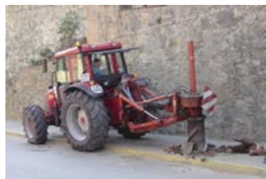
Una maquinària especial va treure les arrels dels arbres afectant el mínim possible els escossells i el paviment.

Els exemplars talats presentaven greus afectacions derivades de les podres intenses a què havien estat sotmesos històricament, així com a les afectacions sobre les arrels motivades pel pas de serveis o el soterrament de la riera. La mort parcial de les branques principals i del tronc havia generat po-