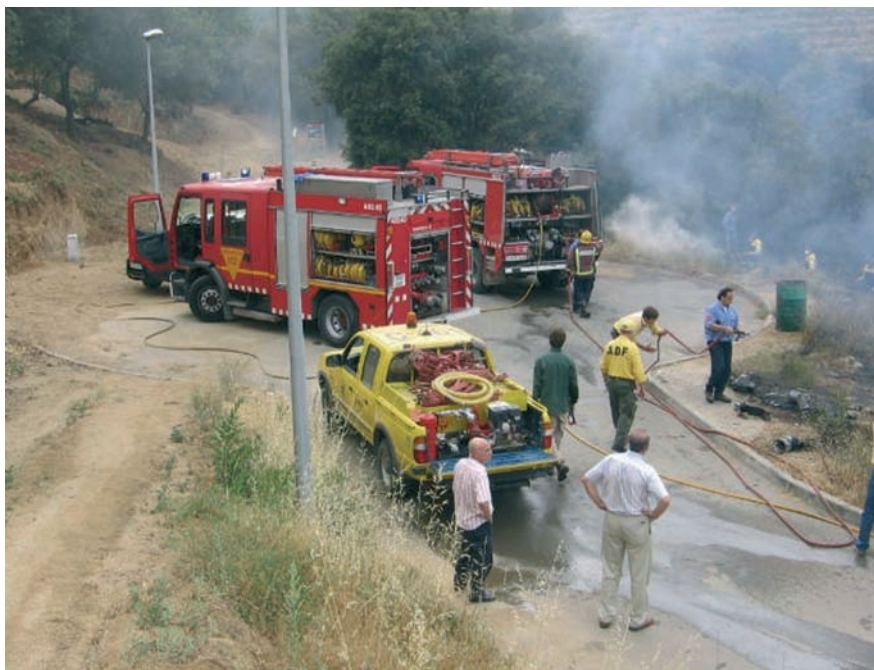
La proximitat del bosc i les cases és un dels principals factors de risc per a la propagació del foc.

Un incendi sense conseqüències recorda als veïns dels barris de muntanya la necessitat de prendre mesures d'autoprotecció.