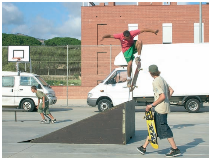
D'esquerra a dreta, el grup Divide&Wenceslao durant l'actuació i skaters practicant salts a la pista exterior del poliesportiu.