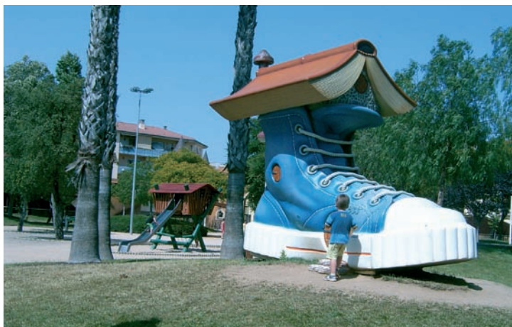
Un dels grups van anar d'excursió a Malgrat de Mar, al Parc Francesc Macià.

grat de Mar, Sant Quintí de Mediona o Diverjoc de Mataró. El darrer dia, el 27 de juliol, es va organitzar una festa de l'escuma per acomiadar els nens i nenes fins a setembre o fins l'any vinent.