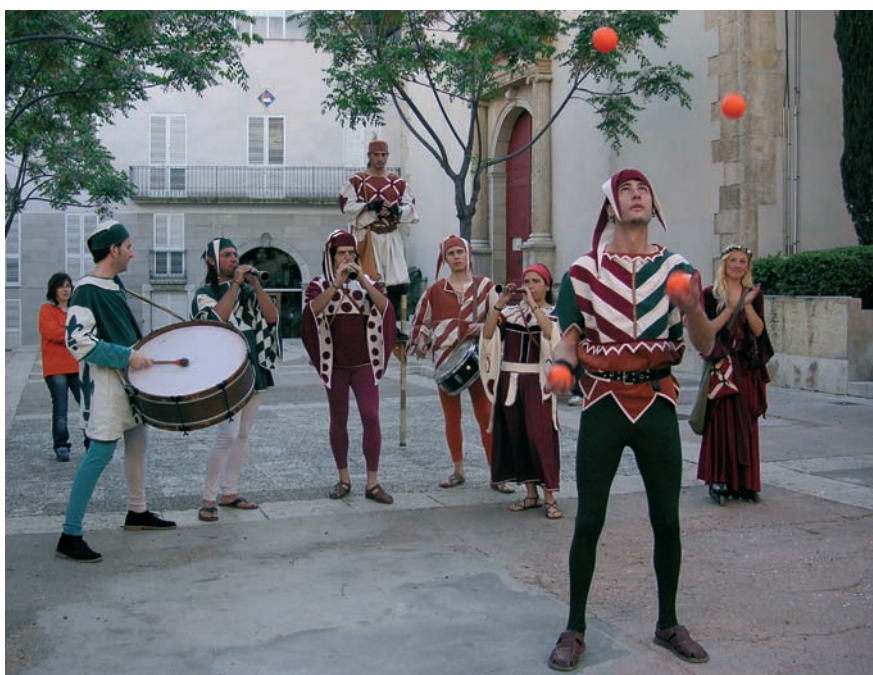
L'espectacle de circ medieval Cirkatum tindrà lloc el dimecres 1 d'agost, a la plaça Antoni Pujadas, a les 18.30h.

Una de les novetats del programa és l'espectacle de circ medieval Cirkatum que es podrà veure l'1 d'agost, a la Plaça Antoni Pujadas, a partir de les 18.30h. És un espectacle com els d'abans, amb tres actes, on còmics i tots els artistes inciten el públic a participar espontàniament d'una gran festa. Vuit actors amb un vestuari d'època convertiran la plaça en un espai màgic on grans i petits podran viatjar al món del circ amb malabaristes, acrobates, ballarines, xanquers i músics.