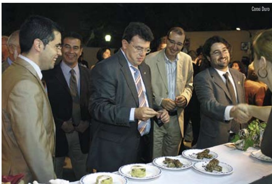
INAUGURACIÓ OFICIAL DE LA 32a FESTA DE LA VEREMA

1r premi Farmàcia R. Gómez Menció especial Elfos