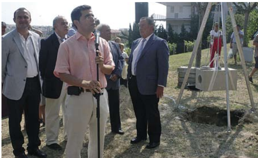
Acte de col·locació de la primera pedra de la piscina.

El 10 de setembre es va posar la primera pedra de la piscina i el calendari d'obres preveu que es podrà inaugurar durant la tardor del 2007.