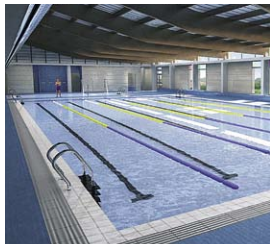
Projecció tridimensional de l'interior de l'edifici, en primer terme la piscina gran i en segon, la petita.

L'acte de la col·locació de la primera pedra va comptar amb la presència de nombrosos aïllencs i aïllenques que, acompanyats per 14 colles geganteres, no van voler perdre's el primer pas de l'inici de les obres.